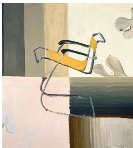
1. Anton Henning Chairpainting No. 2, 1993

Öl auf Leinwand // Oil on canvas , 170 cm x 150 cm