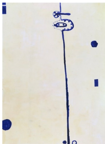
2. Anton Henning Kiss, 1991

© Anton Henning/VG Bild-Kunst Bonn, 2025