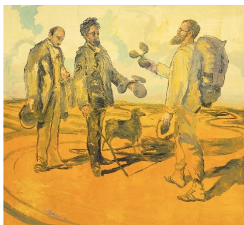
3. Anton Henning La Rencontre No. 4, 2004

© Anton Henning/VG Bild-Kunst Bonn, 2025 Foto // Photo : Jörg von Bruchhausen