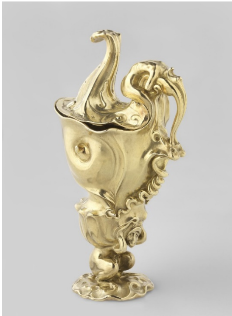
Adam van Vianen (I)