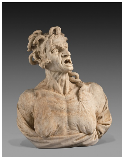
Giusto le Court

Sarah Campbell Blaffer Foundation, The Museum of Fine Arts, Houston