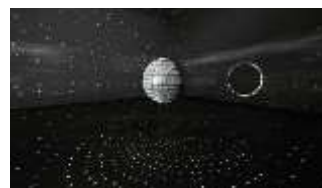
9. Mischa Kuball Space-Speech-Speed, 1998/2001

© VG Bild-Kunst, Bonn 2026 Foto: Frank Vinken