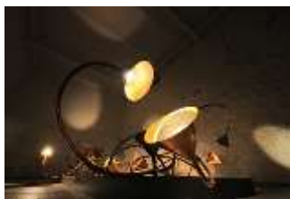
4. Rebecca Horn Lotusschatten, 2006

© VG Bild-Kunst, Bonn 2026 Foto: Frank Vinken