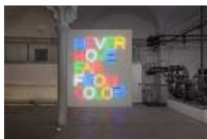
7. Maurizio Nannucci NEVER MOVE FAR FROM COLOR, 2017/2018