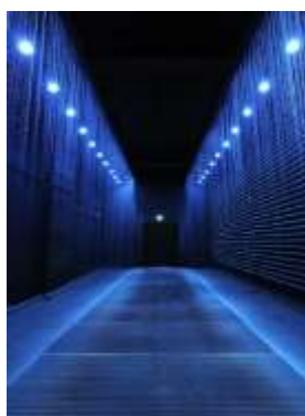
10. Olafur Eliasson Der reflektierende Korridor. Ent- wurf zum stoppen des freien Falls, 2002