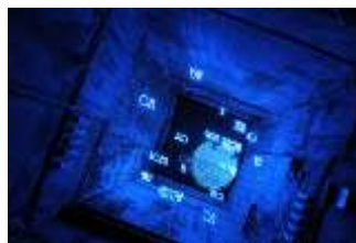
5. Jan van Munster ICH (Im Dialog), 2003/2005

© VG Bild-Kunst, Bonn 2026 Foto: Frank Vinken