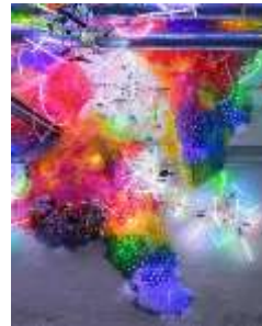
3. Adela Andea Chaos Extructa, 2022