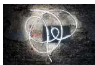
12. Brigitte Kowanz Fall of the Wall, 2019

© VG Bild-Kunst, Bonn 2026