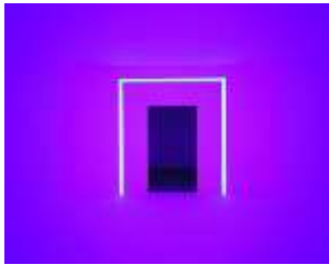
1. James Turrell Floater 99, 1999/2001