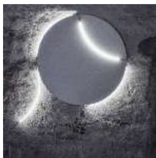
8. François Morellet Décrochage N° 6, 2006