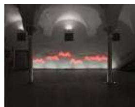
6. Jan van Munster Ratio, 1999

© VG Bild-Kunst, Bonn 2026 Foto: Frank Vinken