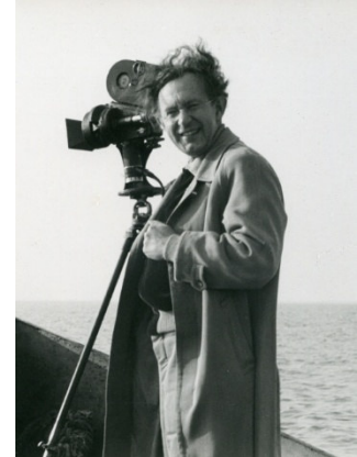
Alfred Ehrhardt bei Filmaufnahmen im Wattenmeer um 1955