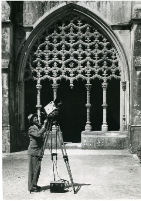
Alfred Ehrhardt filmt den Kreuzgang in Batalha, Portugal 1952