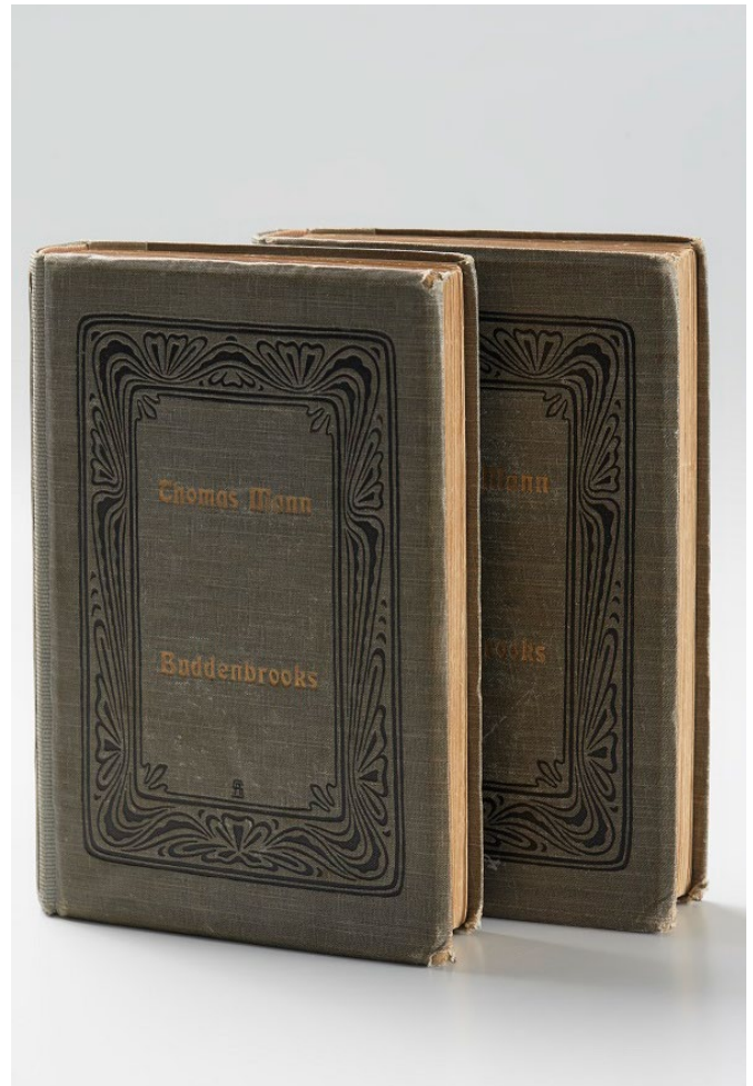
Erstausgabe Buddenbrooks , Band 1 und 2

Partizipative Ausstellungsmodul verbinden „Family Affairs“ mit der Stadt und der jungen Generation. Lübecker Schüler:innen überführen im Kontext des Kunstunterrichts einzelne Ausstellungsabschnitte und deren Themen in eigene Kunstwerke. Fünf dieser Installationen und Plastiken werden ausgewählt und in die Ausstellung integriert.