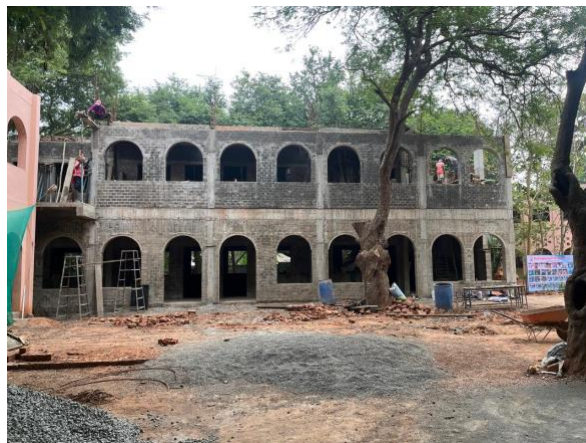
Arbeiten in vollem Gang (Januar 2025)

Ein Resultat ihres guten Rufes in der Gegend, sah sich die Schule gezwungen, mehr Schulraum zur Verfügung zu stellen. Inzwischen dürfte das neue Schulgebäude fertiggestellt sein.