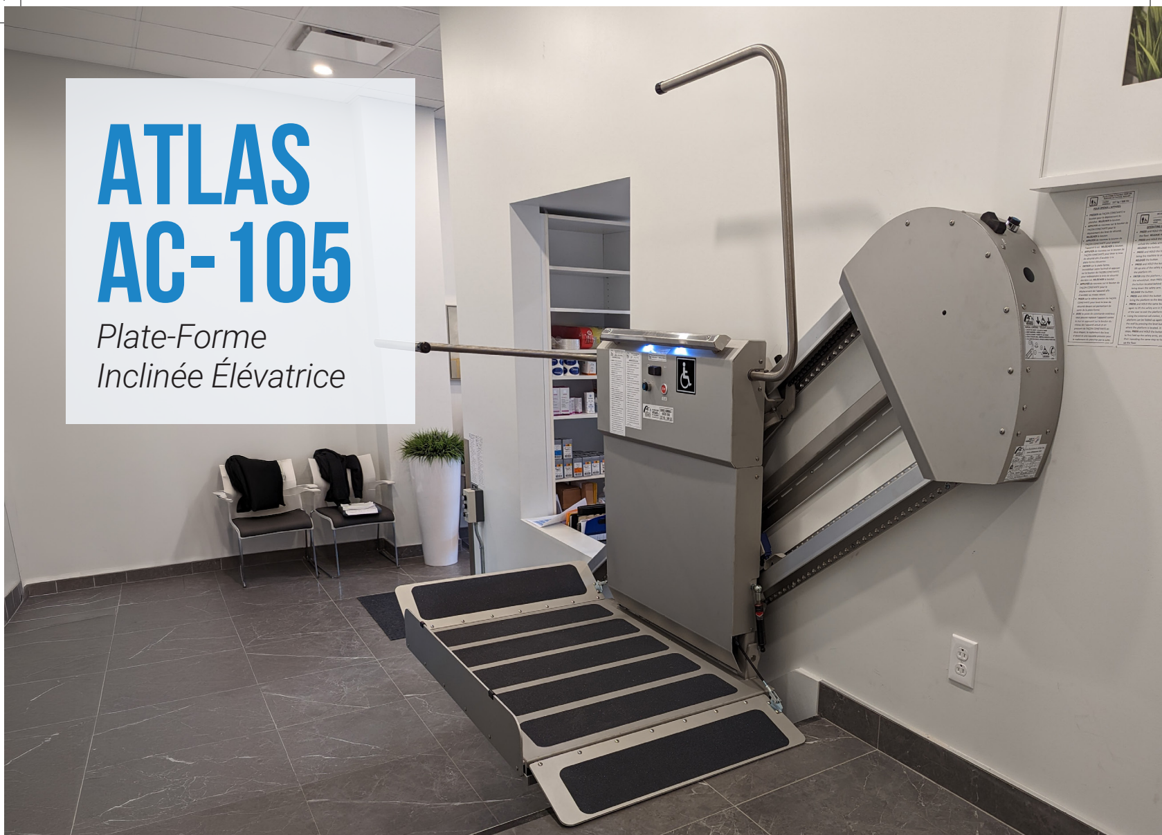
Plate-Forme Inclinée Élévatrice