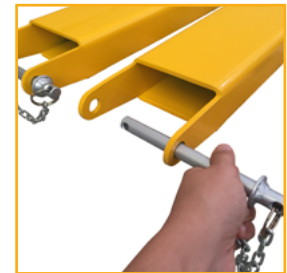
PINO DE BLOQUEIO

Sistema de travamento na base do garfo com pino de bloqueio.