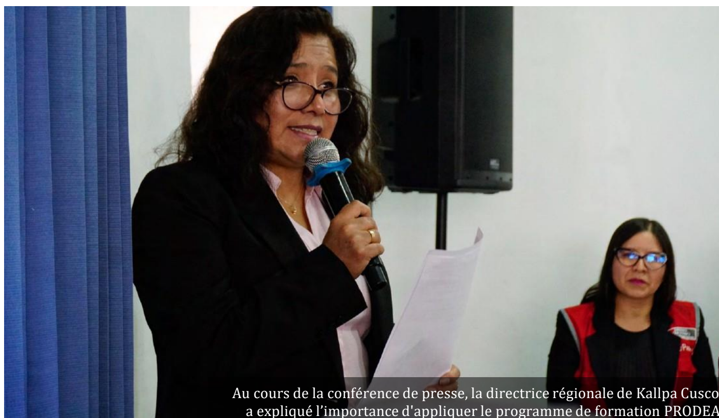
Au cours de la conférence de presse, la directrice régionale de Kallpa Cusco a expliqué l'importance d'appliquer le programme de formation PRODEA

« PRODEA a mis au point diverses stratégies de formation visant à renforcer les compétences des acteurs de l'éducation. »