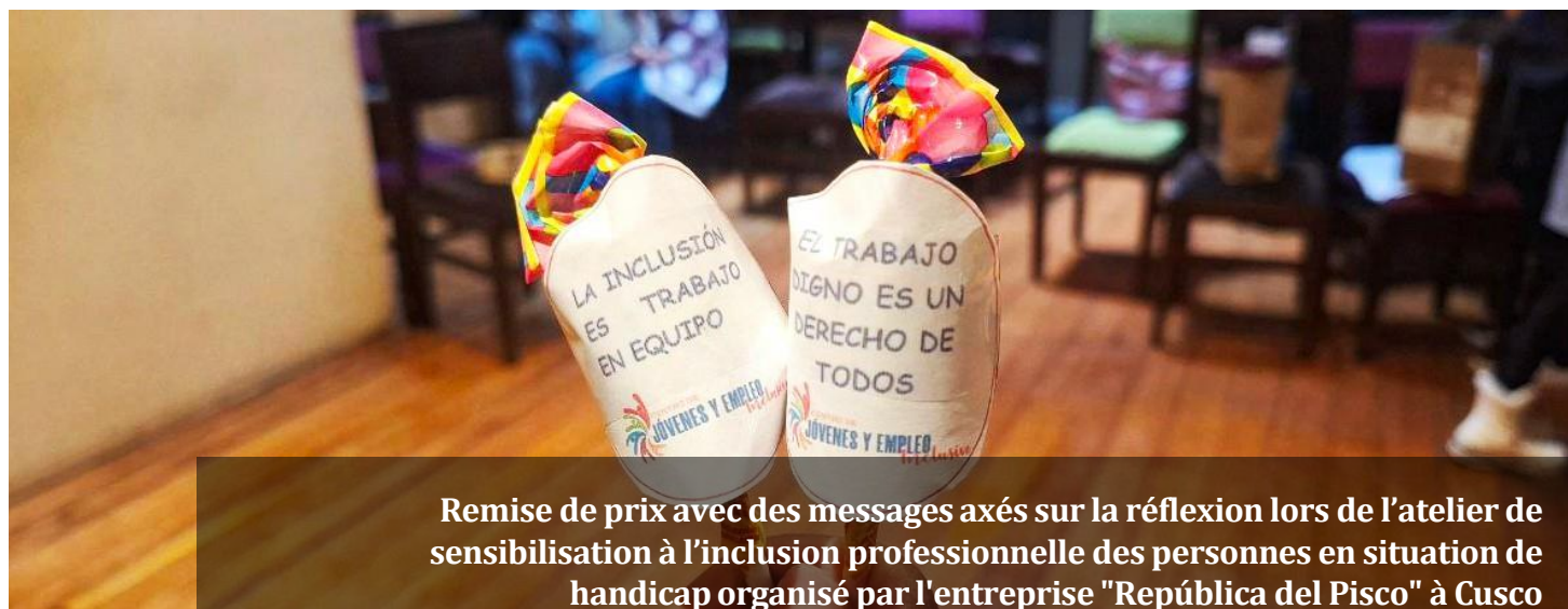
Remise de prix avec des messages axés sur la réflexion lors de l'atelier de sensibilisation à l'inclusion professionnelle des personnes en situation de handicap organisé par l'entreprise "República del Pisco" à Cusco

En fin de compte, chaque geste compte. Nous continuons à avancer vers un monde où l'intégration n'est pas seulement un mot, mais une pratique qui transforme les réalités, rend digne les personnes et enrichit les communautés.