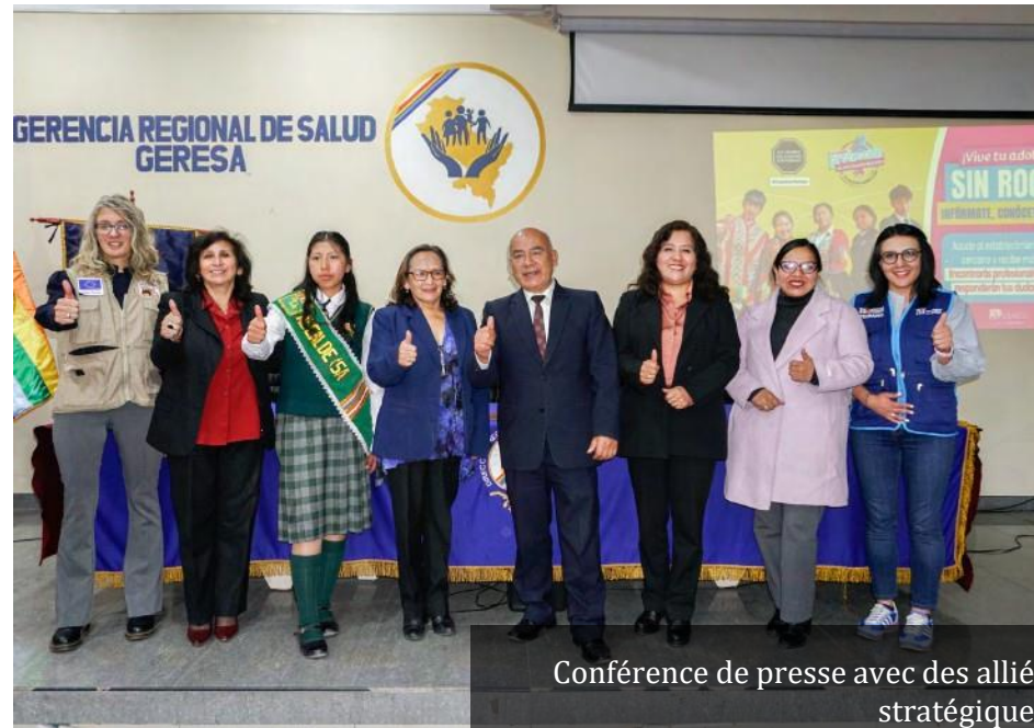
Conférence de presse avec des alliés stratégiques

Pour conclure l'événement, il a été souligné que, face à cette problématique de santé publique, l'articulation interinstitutionnelle et la participation de la communauté éducative sont essentielles pour que les adolescent.e.s de Cusco planifient leur