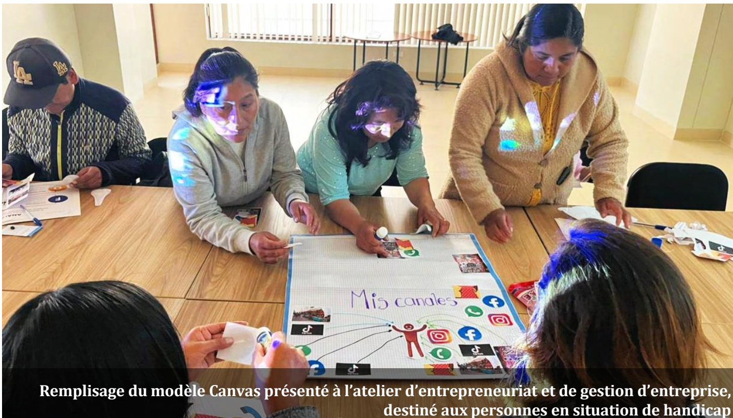
Remplissage du modèle Canvas présenté à l'atelier d'entrepreneuriat et de gestion d'entreprise, destiné aux personnes en situation de handicap