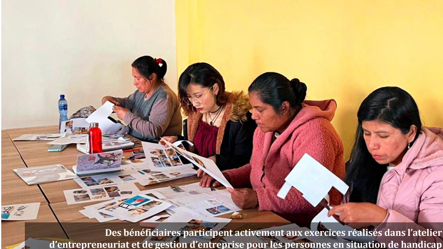
Des bénéficiaires participent activement aux exercices réalisés dans l'atelier d'entrepreneuriat et de gestion d'entreprise pour les personnes en situation de handicap