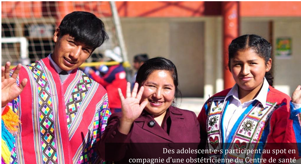
Des adolescent.e.s participent au spot en compagnie d'une obstétricienne du Centre de santé