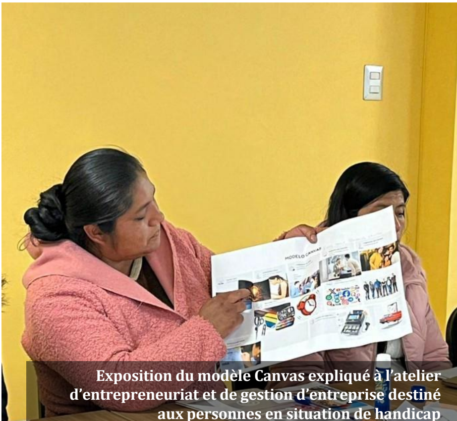
Exposition du modèle Canvas expliqué à l'atelier d'entrepreneuriat et de gestion d'entreprise destiné aux personnes en situation de handicap

Dans le cadre de son programme complet de formation, l'atelier sur l'entrepreneuriat et la gestion d'entreprises a été réalisé avec pour objectif de renforcer les capacités des participantes et leur fournir de nouveaux outils pour leur vie personnelle et professionnelle.