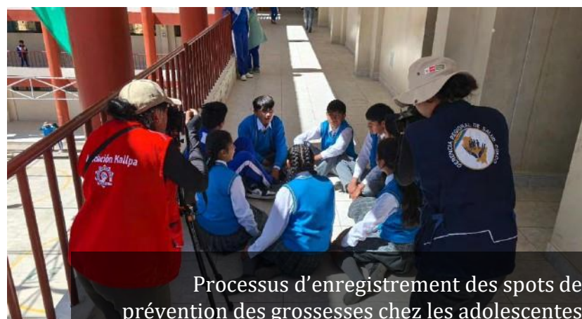
Processus d'enregistrement des spots de prévention des grossesses chez les adolescentes

Des informations ont également été diffusées concernant les services des soins disponibles dans les Centres de Santé et sur