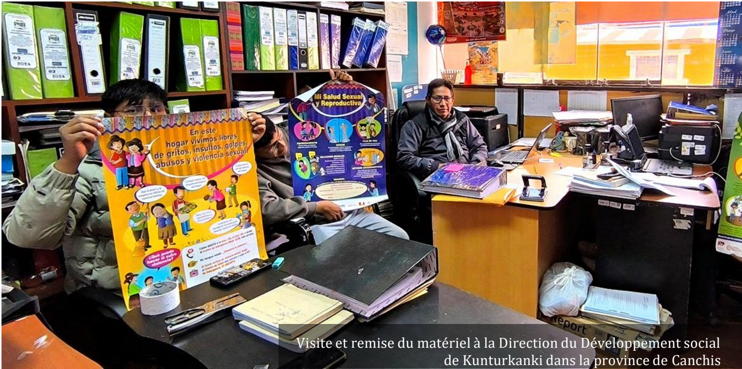
Visite et remise du matériel à la Direction du Développement social de Kunturkanki dans la province de Canchis