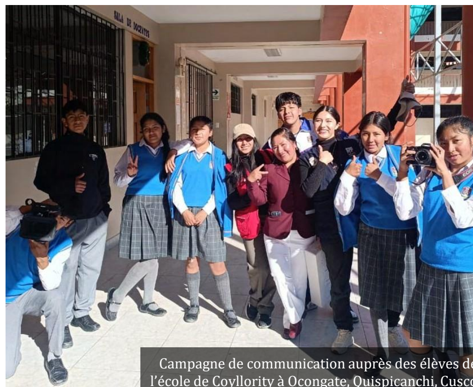
Campagne de communication auprès des élèves de l'école de Coyllority à Ocongate, Quispicanchi, Cusco

« Les enregistrements ont été réalisés avec la participation d'étudiant.e.s des zones urbaines et rurales, ainsi qu'avec du personnel de santé, qui ont par la suite diffusé des messages sur l'importance de prendre des décisions claires [...] ».