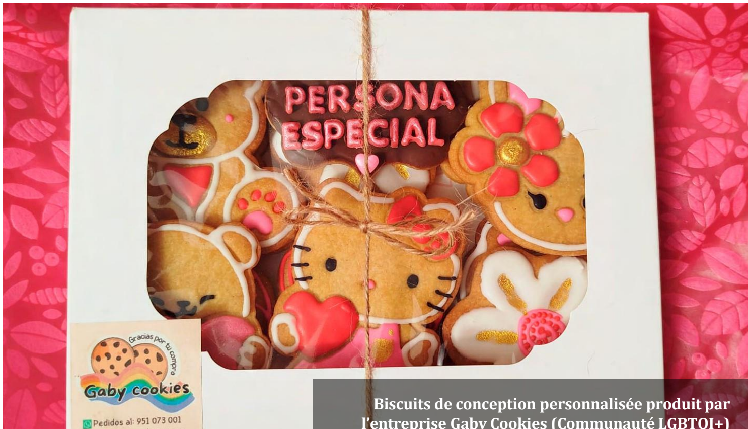
Biscuits de conception personnalisée produit par l'entreprise Gaby Cookies (Communauté LGBTQI+)