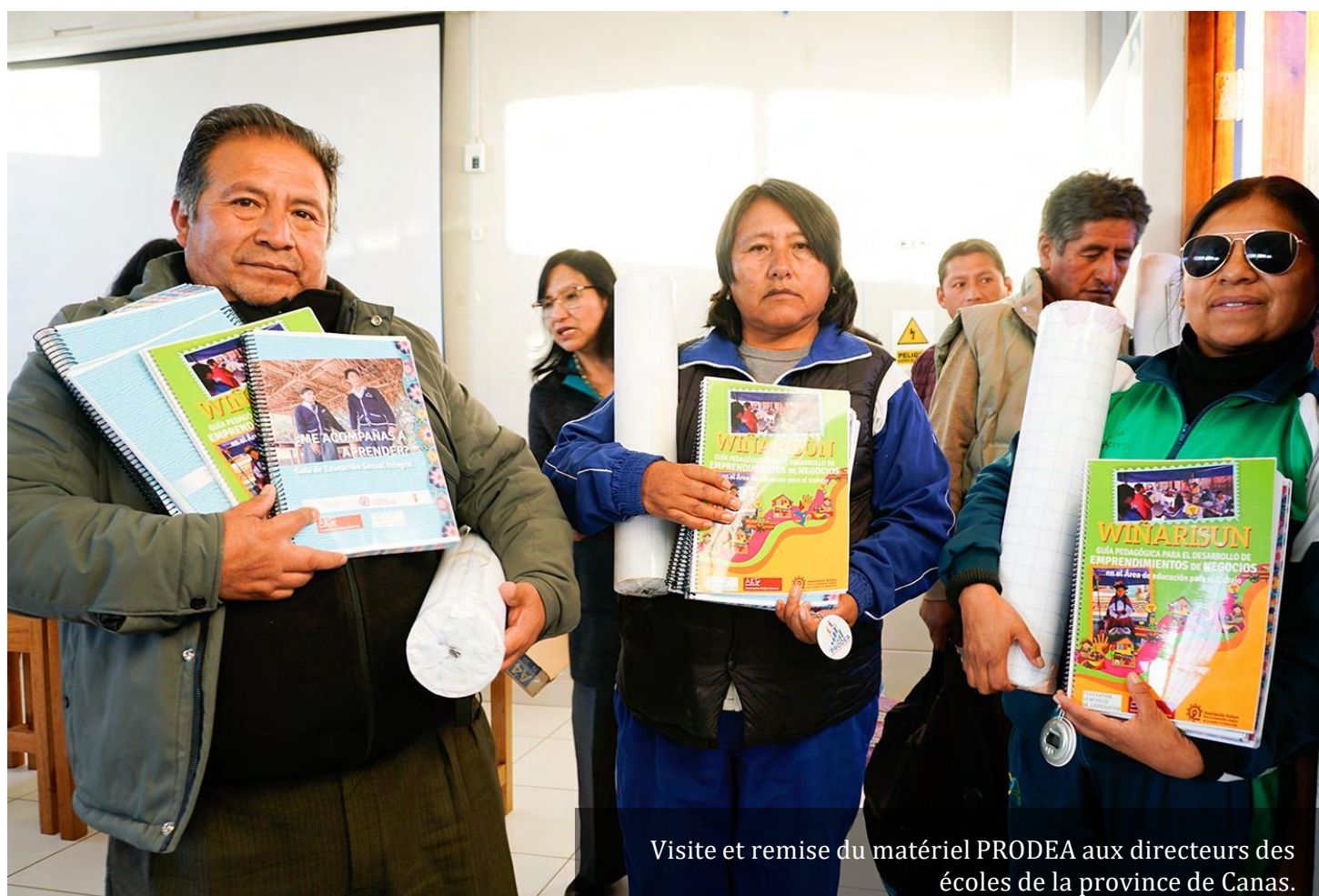
Visite et remise du matériel PRODEA aux directeurs des écoles de la province de Canas.

"Ces interventions ont renforcé les compétences pédagogiques des enseignant.e.s et ont mis en avant la création des espaces sûrs pour le développement intégral des adolescent.e.s."