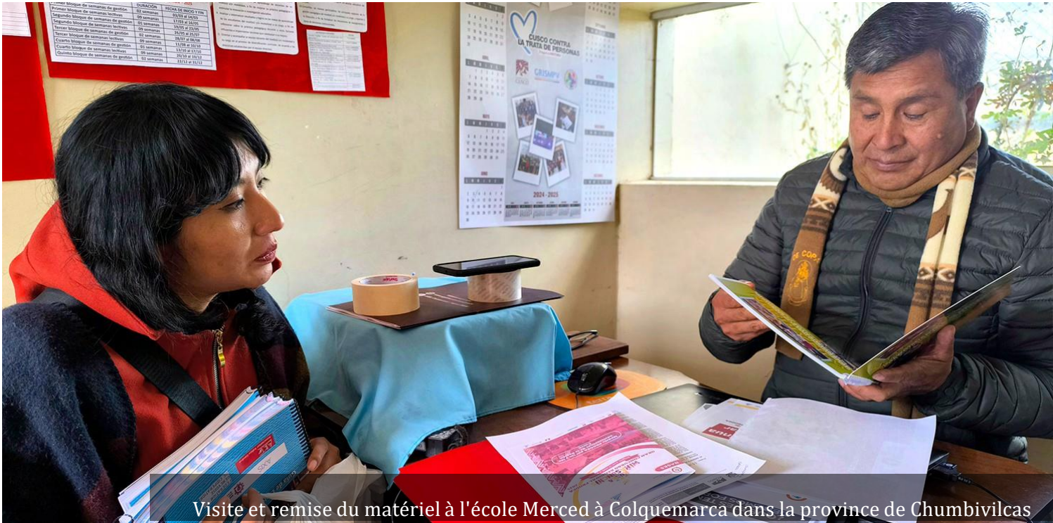
Visite et remise du matériel à l'école Merced à Colquemarka dans la province de Chumbivilcas