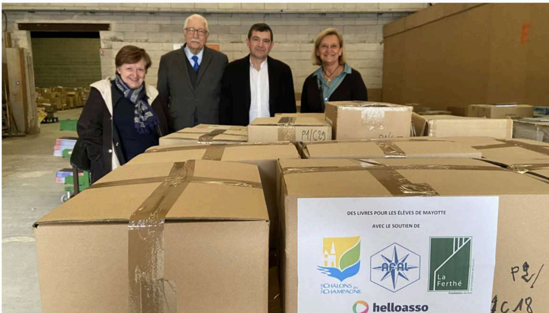
Adiflor a acheminé 6 000 livres à Mayotte, archipel durement frappé par deux cyclones en début d'année, et a été aidé pour cette opération par la Ville.

Les élus ont accordé un soutien financier à deux associations, Adiflor et Châlons Agglo badminton lors de la dernière séance du conseil municipal fin avril.