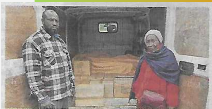
L'association Livre en fête de Guinée Conakry est venue récupérer des livres vendredi.

https://www.lunion.fr/id700374/article/2025-03-23/les-jeunes-ont-ete-recompenses-quant-leur-investissement-pour-la-francophonie