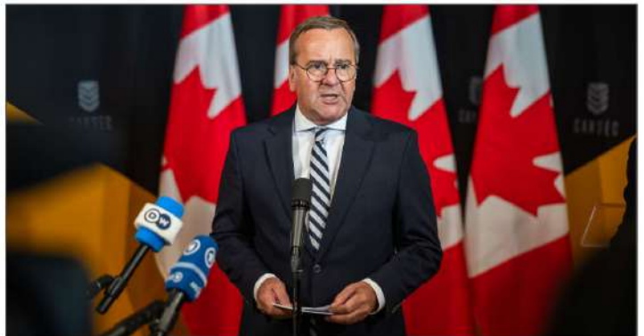
Bundesverteidigungsminister Boris Pistorius hat am 27. Mai Kanada besucht und sich in Ottawa mit seinem kanadischen Amtskollegen David McGuinty getroffen und auf der Rüstungsmesse CANSEC eine Rede gehalten.