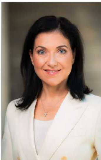
Ministerin Katherina Reiche

Die deutsch-chinesischen Wirtschafts- und Handelsbeziehungen sind