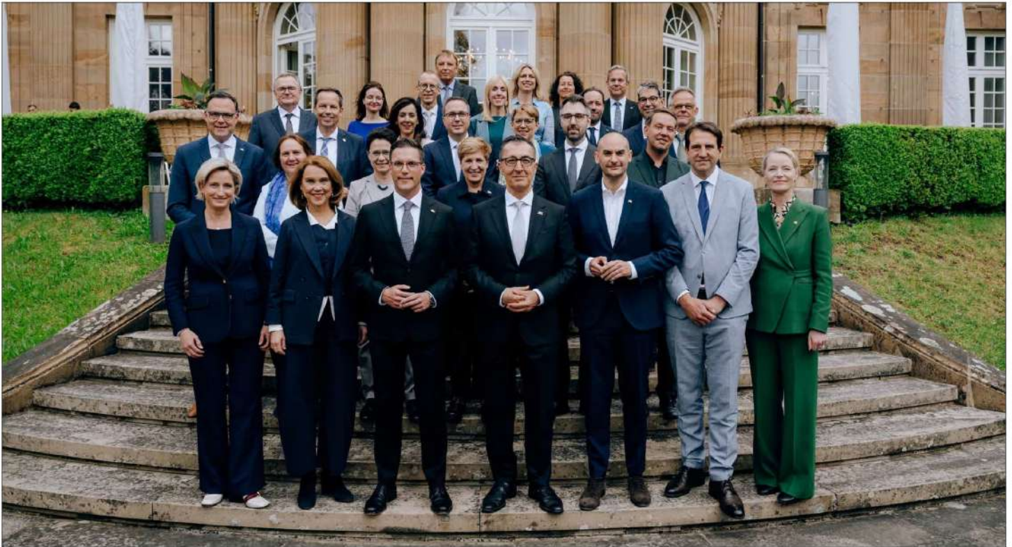
Die neue Landesregierung von Baden-Württemberg mit dem Ministerpräsidenten Cem Özdemir (4. von links in der vorderen Reihe) den stimmberechtigten Regierungsgliedern, den politischen Staatssekretärinnen und Staatssekretären sowie den politischen Beamten vor der Villa Reitzenstein in Stuttgart.