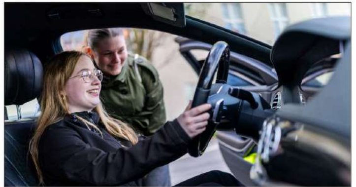
Girls' Day im Verteidigungsministerium: Die Teilnehmerinnen lernten etwas über die Berufsfelder der Bundeswehr und Personenschützerinnen erklärten ihre Ausrüstung und wie ihre Fahrzeuge aufgebaut sind.