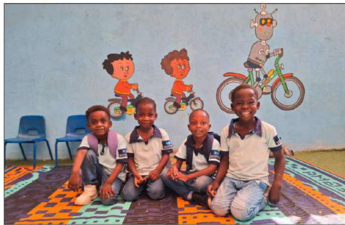
Einige Kinder in den SOS-Kinderdörfern im Sudan

„Der Ort ist anders, aber die Kinder brauchen trotzdem die gleiche Fürsorge und Aufmerksamkeit“, erklärt Somaia, eine SOS-Mutter.