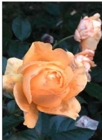
Die Rose "Julia Child" will gesehen und bewundert werden.