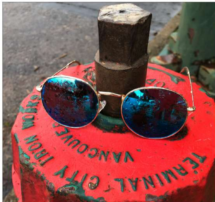
Sonnenbrille mit getönten blauen Gläsern macht auch in Vancouver Sinn.