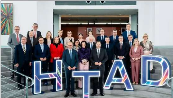
Das Bundeskabinett hat am 20. Mai die Roadmaps für die Schlüsseltechnologien der High Tech Agenda Deutschland #HTAD vorgestellt.