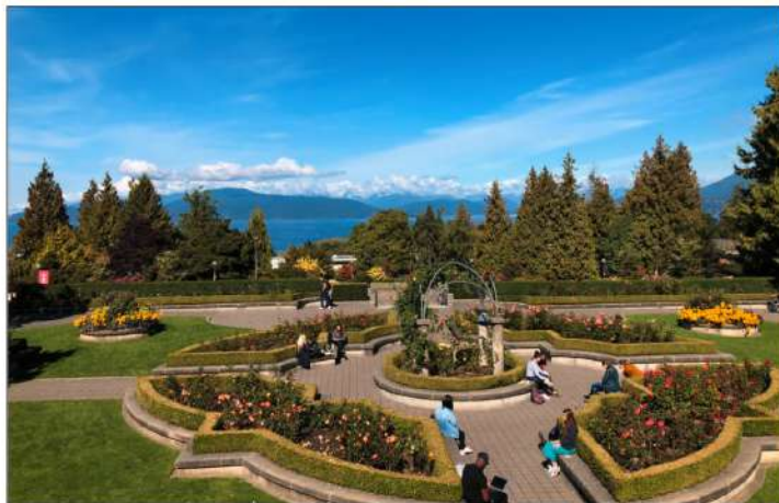
Der Rosengarten nahe der Universität von Vancouver (UBC).