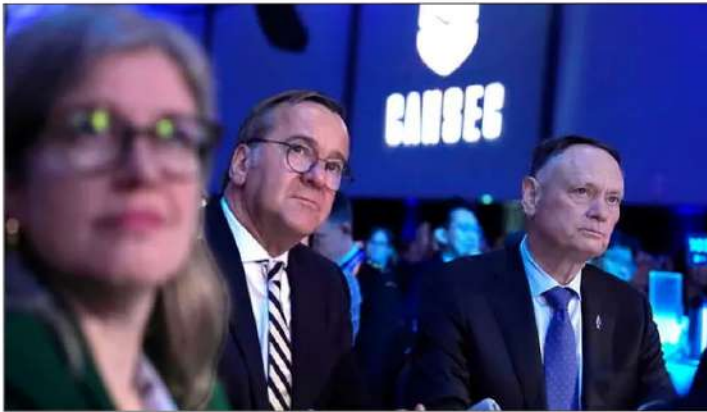
Der deutsche Bundesverteidigungsminister Boris Pistorius (links) mit seinem kanadischen Amtskollegen David McGuinty bei der Rüstungsmesse CANSEC in Ottawa.