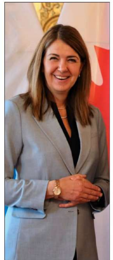
Sind Danielle Smiths Tage als Ministerpräsidentin gezählt?