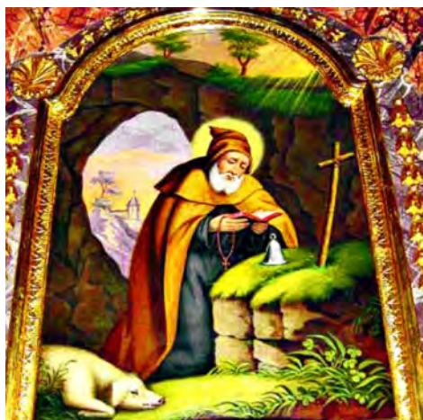
Der heilige Antonius der Grosse

Einst kamen die Bauern und Hirten am Antoniustag ins Dorf, um dem Schutzpatron zu danken und anschliessend in geselliger Runde beisammen zu sein, ein Brauch, der weiter gepflegt werden will. Die Eucharistiefeier beginnt um 9.30 Uhr.