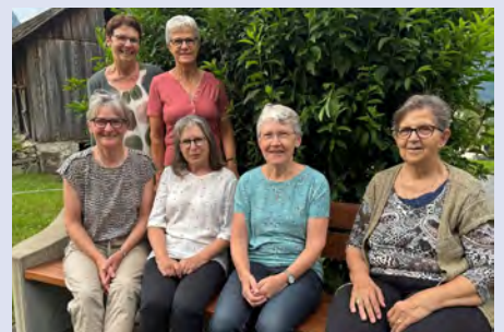
Das Team Krankenkommunion Gosmergartä

Mit diesem freiwilligen Dienst an unseren betagten Mitmenschen werden wir immer wieder mit einem Lächeln oder