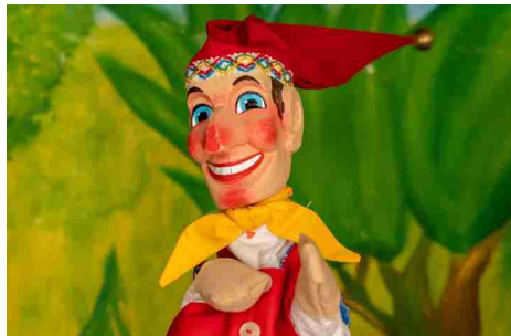
Das Kasperlitheater kommt nach Bürglen

Beginn der Vorstellungen «Am Vreneli sys Gärtli und der beesi Drachä» ist um 14.30 Uhr und 15.45 Uhr im Kirchgemeindehaus. Anmeldung bei Claudia Bissig, Telefon 079 784 52 50, Kosten CHF 5.00 pro Person. Elternzirkel Bürglen