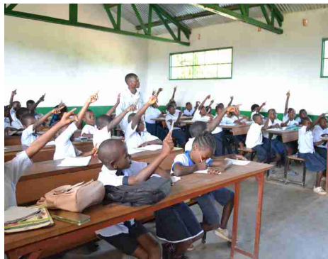
Schule in der Demokratischen Republik Kongo, ermöglicht durch Don Bosco, Jugendhilfe weltweit.

Die Pfarrei Bürglen unterstützt mit dem Hilfsprojekt in den Jahren 2025 und 2026 die Arbeit der Salesianer Don Boscos in der Demokratischen Republik Kongo. Mit Spenden und dem Erlös aus dem Fastenri-