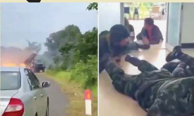
હજાર વર્ષ જૂનું પ્રેઠ વિહાર મંદિર જ્યાં આવેલું છે તે વિસ્તાર પર કબજા અંગે મોટો વિવાદ છે

બૅંગકોક, તા. ૨૪(એપી): થાઈલેન્ડ અને કંબોડિયાએ તેમનો સંઘર્ષ તીવ્ર રીતે વકરતા આજે સરહદ પર અનેક સ્થળે એકબીજા પર સામસામા હુમલા કર્યા હતા જેમાં