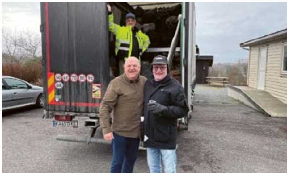
Fra innsamlingen på Bømlo.