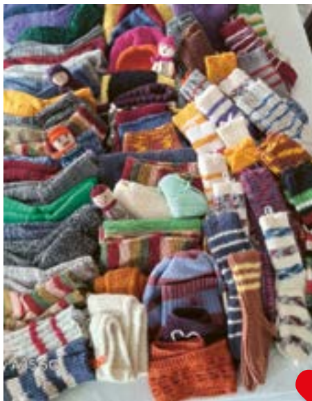
Noen av alle de varme sokkene folk har strikket til Open Heart.

Den årlige innsamlingen på Bømlo fant nylig sted med kjemperespons. Innsamlingen på Klippen, Bremnes og Betania, Møsterhamn ga 650 sekker med diverse nødhjelp og over 130.000 kroner til mat og andre nødvendighetsartikler. Diesel for 23.000 kroner ble sjenerøst sponset av Eidesvik fisk og Aasen shipping. I løpet av uken ble det også holdt flere møter der Halvard Hasseløy talte, og mye folk var samlet.