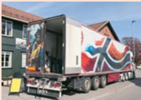
Open Hearts trailer fylles med nødhjelp under aksjonen i Tjølling og Larvik nylig.

På Søre Sunnmøre og i Ålesund var det pinsekirkene i Ålesund, Ulsteinvik, Myrvåg og Leikong, sammen med Open Heart som stod bak innsamlingene. Totalt på Søre Sunnmøre kom det inn 800 sekker nødhjelp og med kollekter fra Filadelfia Ulsteinvik og Pinsekirka Sion Gurskøy kom det inn totalt 140.000 kroner.