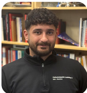
Diyar Hakki Leder Fellesforbundet avd 1 Oslo-Akershus