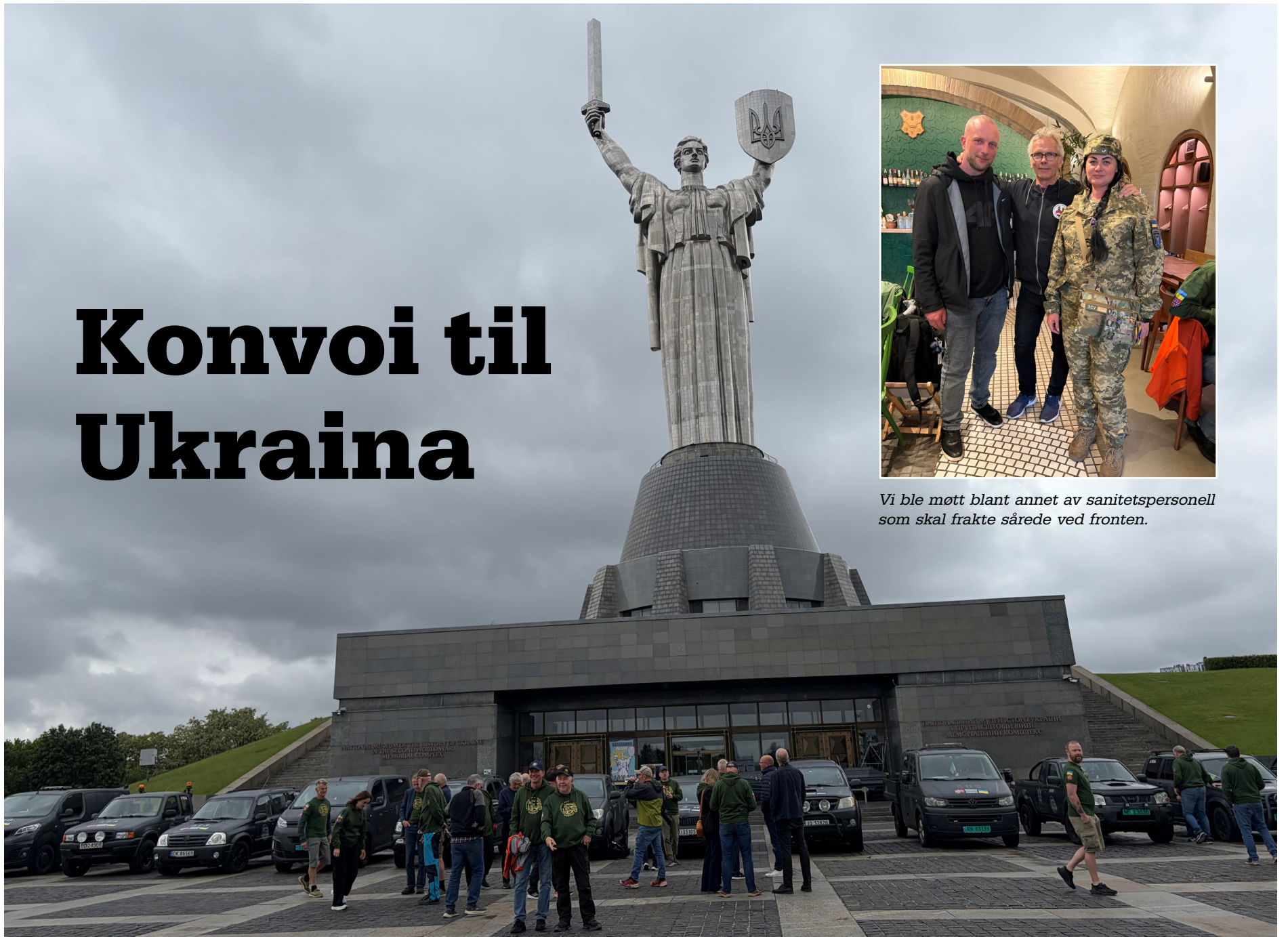
Vi ble møtt blant annet av sanitetspersonell som skal frakte sårede ved fronten.

Her er konvoien framme ved «Mor Ukraina-statuen» i Kiev.