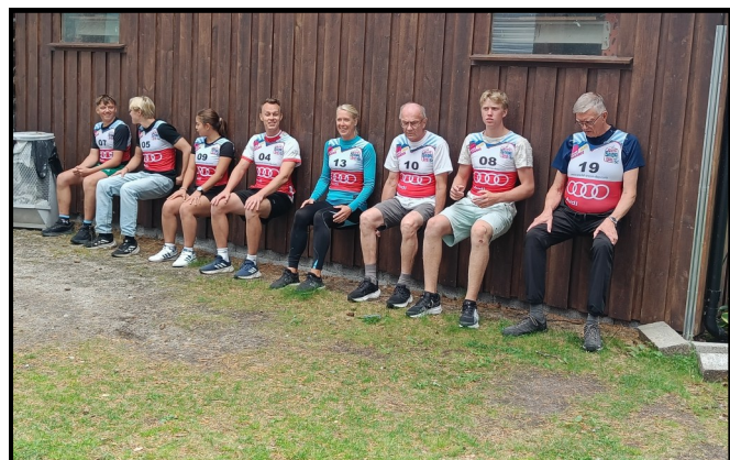
Mye gøy under Kick-off weekend!