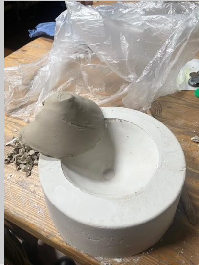
kipsimuotin teko ja valmis kipsimuotti