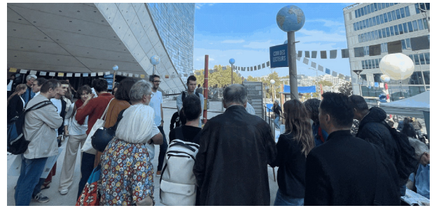
Festival Le Monde, les 22 et 23 septembre 2024