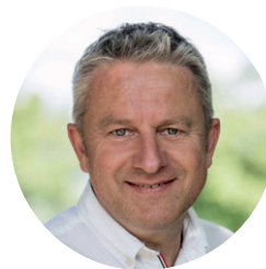
Dirk Zipse Schulheim Rösental

Die Fachgruppe Kind und Jugend Basel-Landschaft traf sich 2025 mehrfach, um institutionelle Themen und Herausforderungen der stationären Jugendhilfe zu bearbeiten. Im Austausch standen Personalquoten, Infrastruktur, gesetzliche Vorgaben sowie Qualitätsanforderungen im Fokus. Ein zentraler Schwerpunkt war die Vorbereitung der Leistungsvereinbarungen ab 2026, insbesondere die Frage, wie qualitative Standards trotz kantonaler Sparmassnahmen gesichert werden können. Diskutiert wurden zudem Transparenz und Vergleichbarkeit von Kosten sowie die Abbildung fachlicher, ethischer und gesetzlicher Anforderungen. Zunehmend zeigt sich eine Diskrepanz und damit eine diskutierte Herausforderung zwischen dem Bedarf der Klientel und der kantonalen Perspektive, da Diskussionen stärker von der Finanzstrategie geprägt sind. Dies führt zu einem Spannungsfeld zwischen qualitativer Aufgabenerfüllung und den finanziellen sowie gesetzlichen Rahmenbedingungen.