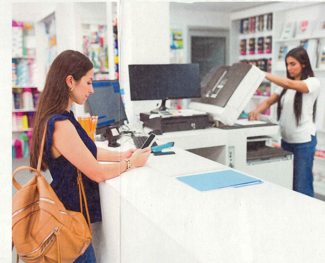
Copyshop: 20 Druckseiten in Farbe kosten je nach Laden bis zu 60 Franken

Im Vergleich aller Shops in der Stichprobe druckte der Copy Blitz in St. Gallen die 100 Schwarz-Weiss-Seiten für Fr. 10.81 am günstigsten. Am meisten verlangte der Copyshop in Chur (50 Franken). Für 20 far-