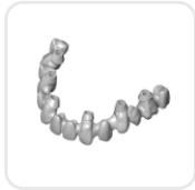
Okluzal Vidalı Protez