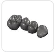
Tam Anatomik Kron