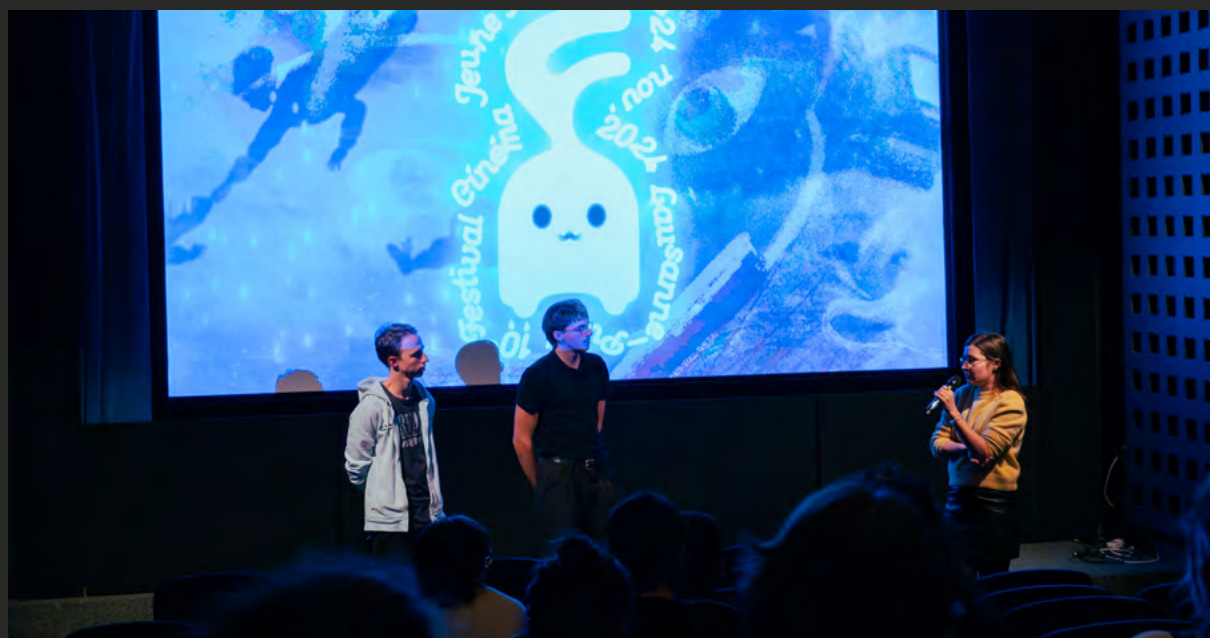
Festival Cinéma Jeune Public 2024

Queste collaborazioni contribuiscono a dare visibilità a #cine, ma costituiscono anche un'ulteriore offerta di mediazione per il pubblico adolescente all'interno dei festival. L'organizzazione di queste proiezioni comuni implica la partecipazione attiva dei team locali, che mantengono il loro ruolo di selezione dei film all'interno della programmazione del festival, di animazione delle attività collaterali e di promozione delle proiezioni.