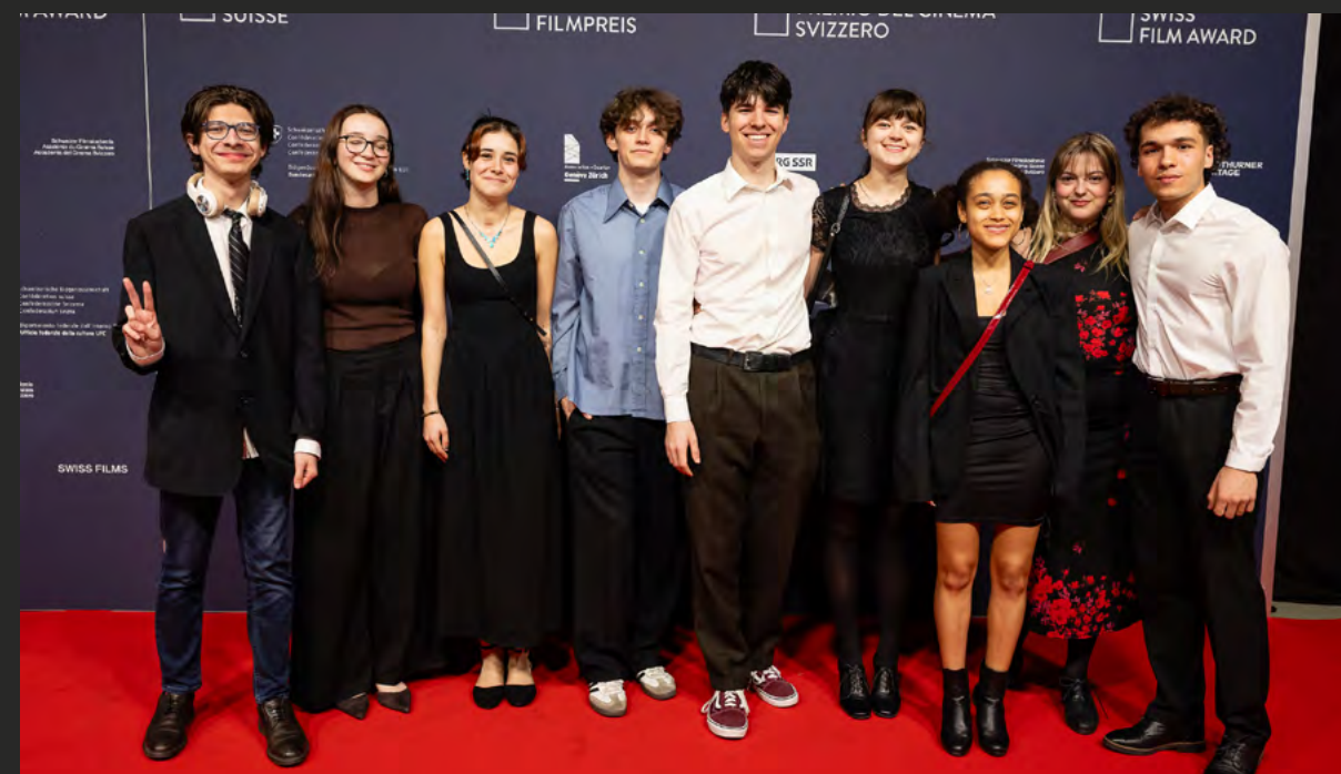
Premio del cinema Svizzero 2025

29.01.25 – #cine Solothurn x Journées de Soleure: WHEN WE WERE SISTERS di Lisa Brühlmann, preceduto dalla proiezione del cortometraggio GAHTS NO LANG di Marion Zeder, Raul Bison, Sven Kristlbauer e da una presentazione del progetto #cine