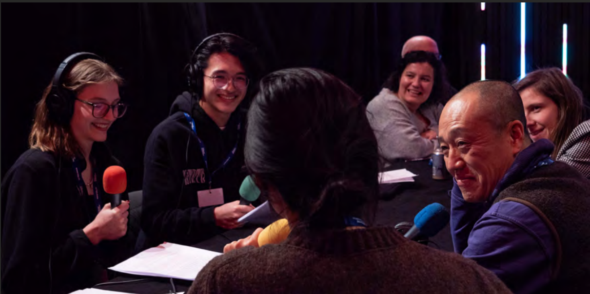
#cine Genève – Radio Black FM