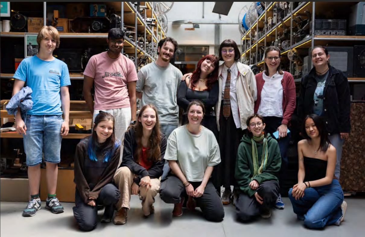
Incontro nazionale

GRAZIE A TUTTE E TUTTI COLORO CHE CONTRIBUISCONO A MANTENERE VIVO IL CINEMA FATTO DAI GIOVANI E PER I GIOVANI!