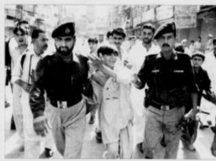
En lokal demonstrant er sikker på belønning for å bli drept i landets kaos.