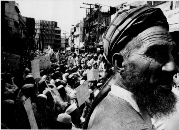
En lokal demonstrant er sikker på belønning for å bli drept i landets kaos.

Av Kadir Zaman og Anis Inghamand