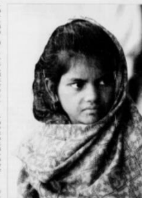
Denne afghanske piken har i en flyktningleir i Sverige.

Preling kveld var det demonstrasjon mot Taliban i Islamabad. Demonstranter var i Taksim. De oppga å ha drept en Taliban. De fikk en belønning på 100 000 rupees.