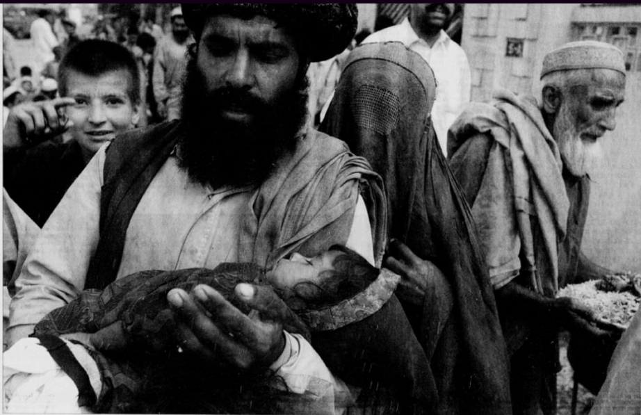
En stolt afghaner har fått med seg sin lille datter og kone prøver desperat å få tak i noe ordentlig mat. I flyktningleiren får man ikke annet enn matløse og hvelstet.

Utrygg flukt De fleste har ingen mulighet til å flykte. De fleste har ingen mulighet til å flykte. De fleste har ingen mulighet til å flykte.