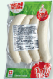
Bratwurst Familia , per 100 g 1.60

Die Tage werden länger, die Abende wärmer – und in Duggingen liegt wieder Grillduft in der Luft. Ob gemütlicher Familienabend, spontanes Grillieren mit Freunden oder der Sommer-Apéro im Garten: Bei uns finden Sie alles für gelungene Grillmomente. Von feinem Fleisch, passenden Beilagen und erfrischenden Apéro-Getränken bis hin zu Holzkohle und Grillanzünder – für einen genussvollen Sommerabend ist gesorgt. Vorbeikommen, entdecken und die Grillsaison genießen!