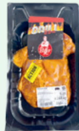
Sommersteak , per 100 g 2.50