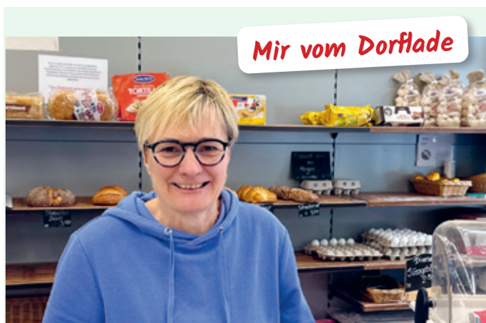
Mir vom Dorflade