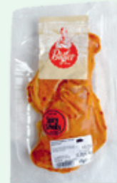
Limited Edition Steak , per 100 g 3.50