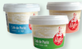
Bigler Café de Paris , z.B. Kräuter, 40 g, 2.–