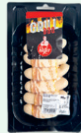
Grillchipolata mit Speck , per 100 g 3.80