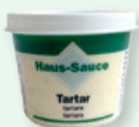
Diverse Haus-Saucen , z.B. Tartar, 110 ml, 2.80