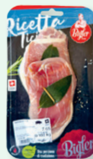
Saltimbocca, per 100 g 4.05

Saltimbocca, Twister mit Körner, Pommel Apfelessig