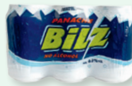
Bilz Panache 0.0% VOL , 6 x 33 cl 9.95