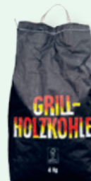
Grill-Holzkohle , 4 kg 8.60