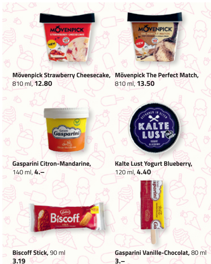
Mövenpick Strawberry Cheesecake, 810 ml, 12.80