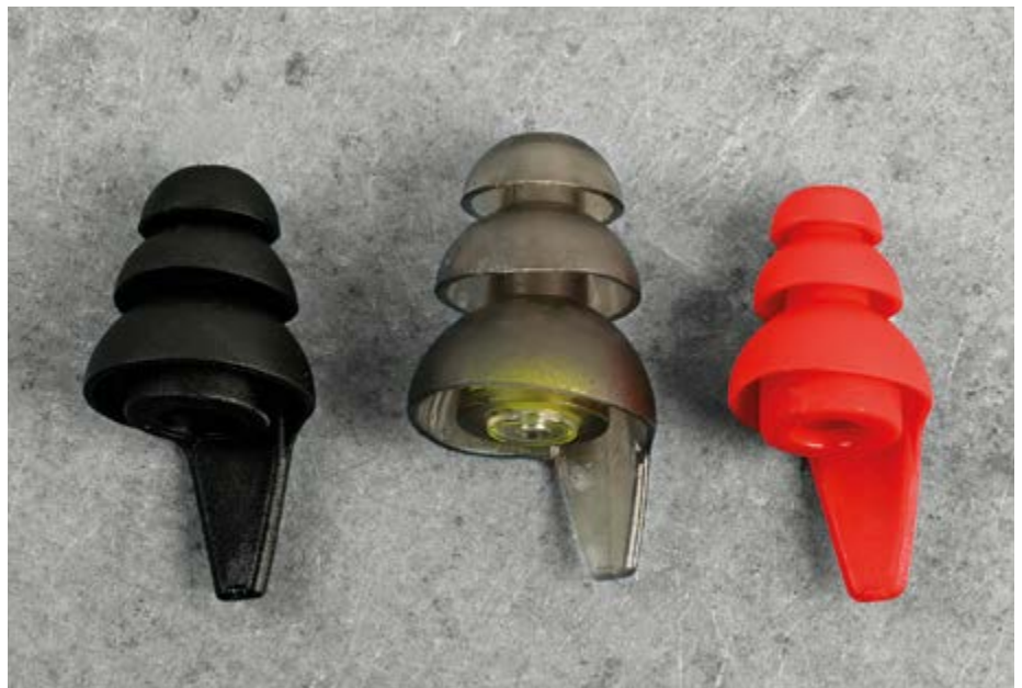
M, L en S: dat scheelt een serieuze slok op een borrel.