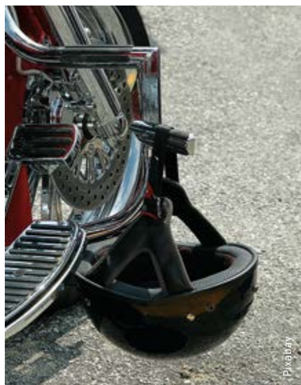
Beter zichtbaar met reflecterende stickers