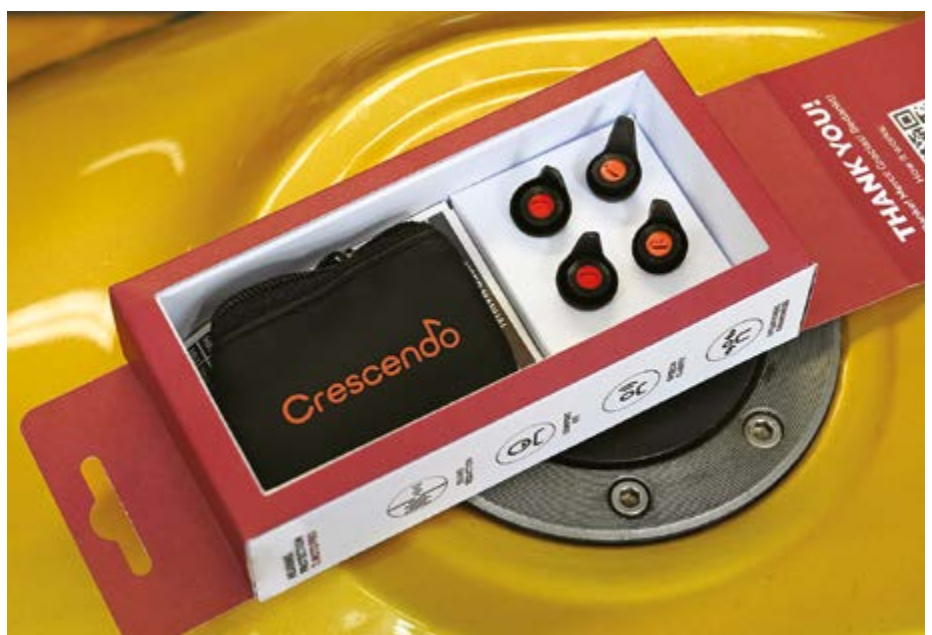
Geleverd in twee maten met twee filters en étui