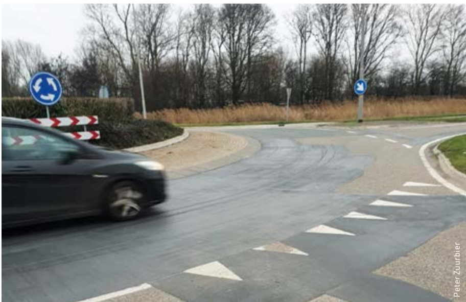
Nieuwe coating op de N249-rotonde bij 't Zand