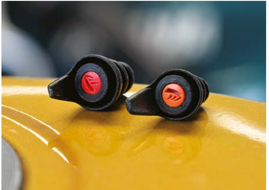
Geleverd met oranje (16 dB) en rode (24 dB) filters

Bij je twee paar Moto Pro-oordoppen krijg je ook twee sets filters. Het oranje setje, de Touring-filters, biedt een gemiddelde demping (SNR) van 16 dB. De rode Moto Pro Sports-filters zitten met 24 dB een heel stuk hoger. Ons advies is om je van die namen Touring en Sports vooral niets aan te trekken. We kennen toermachines die bij 80 km/u aanzienlijk meer herrie op je oren leveren dan sommige sportmachines bij 120. Mooi is dat je op deze manier de keuze hebt. Dat tweede setje filters verhoogt de prijs wel iets, maar niet veel. De complete set met doppen in M en L, Touring- en Sports-filters en een étuitje kost € 29,95. Let op: de set wordt online ook voor een tientje meer aangeboden.