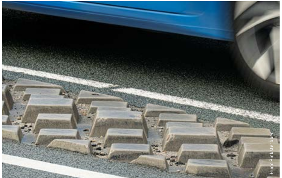
"Ook uw partner voor veilige buitenruimtes." Zeker...