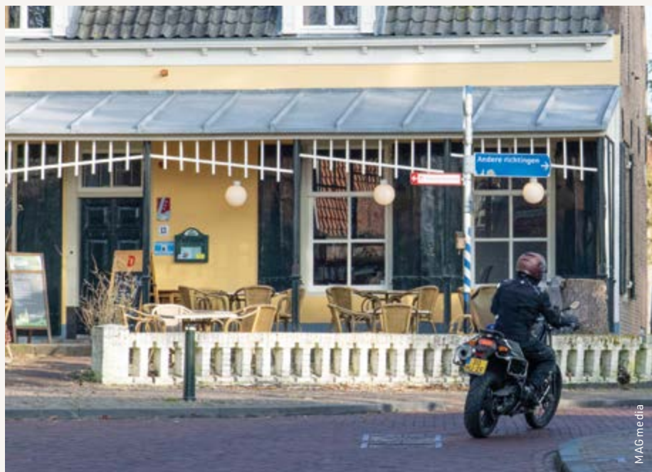
Ook hier gaan ze motorrijders missen...

Op dingen vooruitlopen doen wij ook niet. Maar we gaan wel vol goede moed in beroep tegen het besluit, daarbij mede gesteund door een groep actieve motorrijders uit het oude dorp en directe omgeving. Het onderzoeksrapport onderbouwt de afsluiting niet. De data waar het rapport op gebaseerd is zijn weggegooid (écht – en wij vermoeden dus dat die data nog sterker in ons voordeel spraken). Het oude dorp heeft een kruispuntfunctie, zowel van oost naar west als van noord naar zuid. En dat is nog lang niet alles. Blijft wel dat we met die afsluiting te maken krijgen. Het feit dat we in beroep gaan betekent namelijk niet dat de gemeente moet wachten met het plaatsen van de borden. Juridische mogelijkheden om die plaatsing te voorkomen lijken er op dit moment niet te zijn. Voor wie er nog snel even wil gaan kijken: de Lekdijk tussen Wijk bij Duurstede en Amerongen is in verband met werkzaamheden tot begin 2027 afgesloten. ■