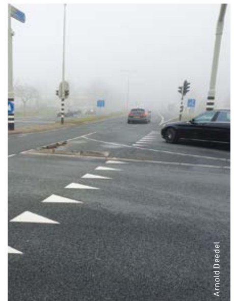
Balken op de N208. De zwarte auto komt van de N207.