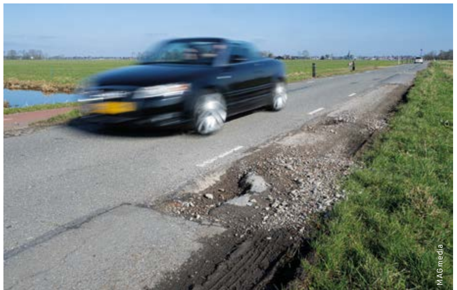
De Genieweg tot afgelopen zomer