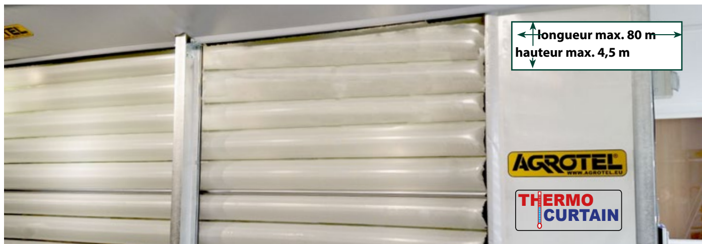
Système 3 avec compartiments d'air isolants, fermé

Aération par le haut, se replie vers le bas ou isolation