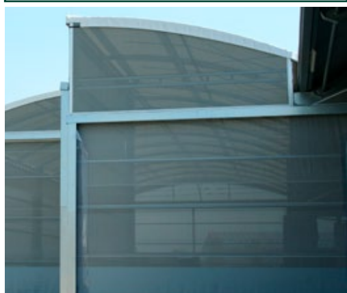
Porte à double enroulement, installation travée simple