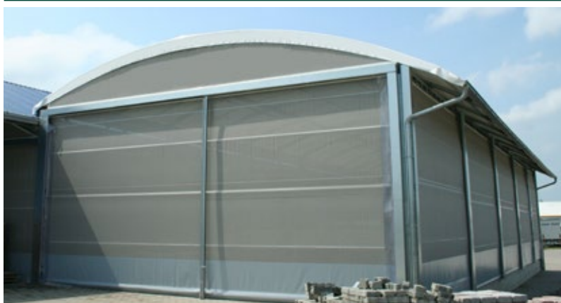
Porte à double enroulement, installation travées multi-plex