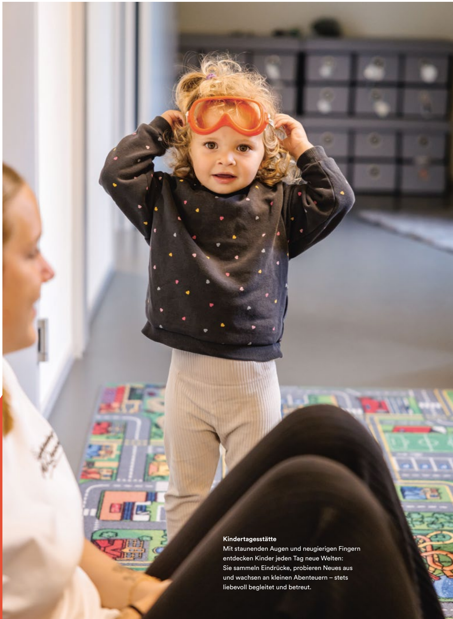
Kindertagesstätte Mit staunenden Augen und neugierigen Fingern entdecken Kinder jeden Tag neue Welten: Sie sammeln Eindrücke, probieren Neues aus und wachsen an kleinen Abenteuern – stets liebevoll begleitet und betreut.