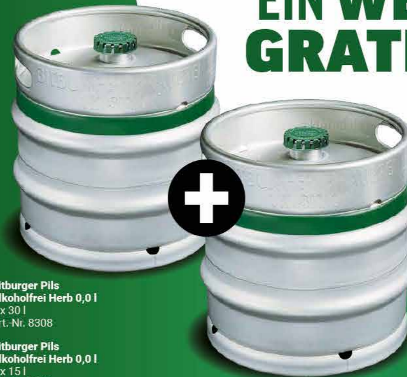
Bitburger Pils Alkoholfrei Herb 0,0 l 1 x 30 l Art.-Nr. 8308