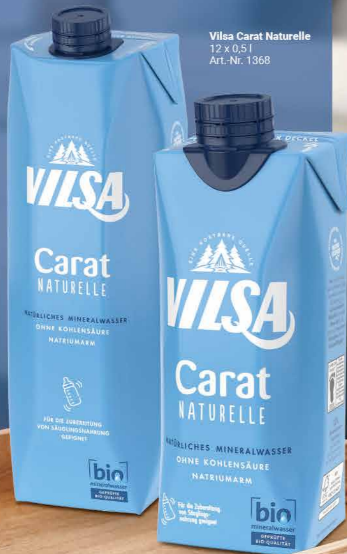
Vilsa Carat Naturelle 12 x 0,5l Art.-Nr. 1368