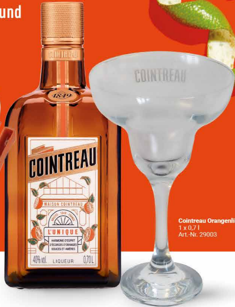
Cointreau Orangenlikör 1 x 0,7 l Art.-Nr. 29003