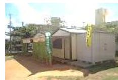
自治会事務所 （銘苅 3 丁目てんとうむし公園内）