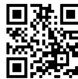
自治会 HP QR コード