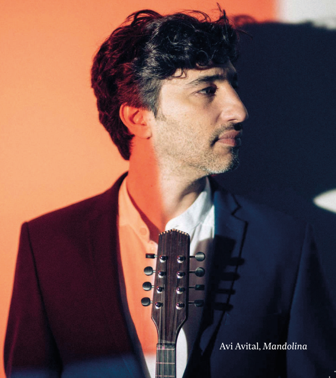
Avi Avital, Mandolina