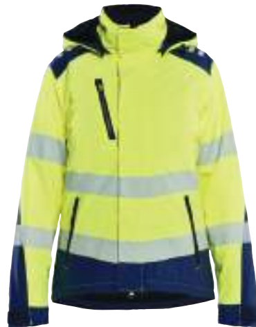
4401 LEICHTE GEFÜTTERTE DAMEN SOFTSHELL WINTERJACKE HIGH VIS