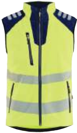
3091 SOFTSHELL WESTE HIGH VIS

EINE AUSWAHL AUS UNSERER SOFTSHELL KOLLEKTION MIT DEM MATERIAL 2513.