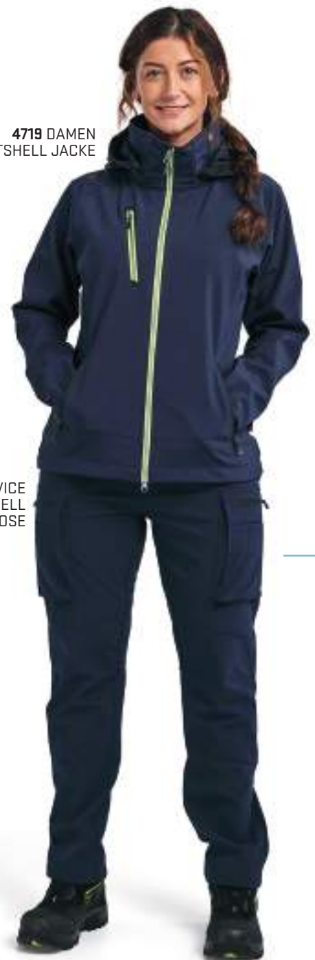
7177 DAMEN SERVICE SOFTSHELL WINTERHOSE