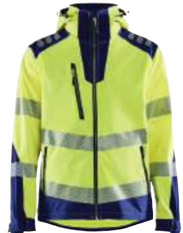
4491 HIGH VIS SOFTSHELL JACKE