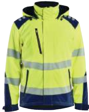
4400 LEICHTE GEFÜTTERTE SOFTSHELL WINTERJACKE HIGH VIS