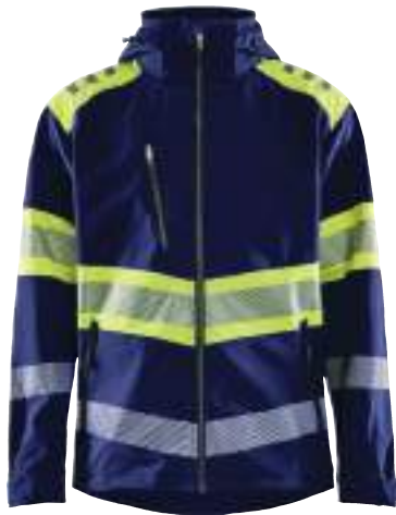
4494 HIGH VIS SOFTSHELL JACKE