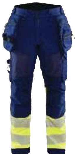
1821 HIGH VIS ARBEITSHOSE SOFTSHELL