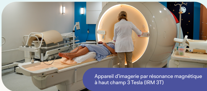
Appareil d'imagerie par résonance magnétique à haut champ 3 Tesla (IRM 3T)