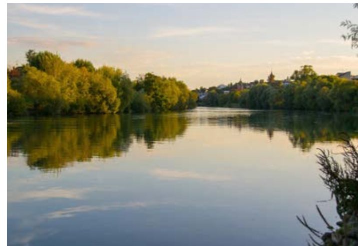
Promenades aux bords de Marne