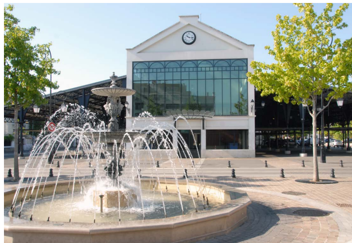
Le marché de La Varenne Saint-Hilaire

A 5 km du bois de Vincennes et avec une liaison à Paris renforcée par l'arrivée du Grand Paris Express à Saint-Maur-des-Fossés, cet emplacement privilégié offrira une praticité au quotidien, tant pour la vie professionnelle que pour la vie de famille.