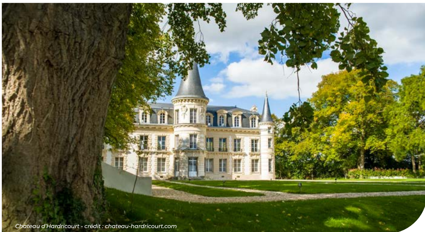
Chateau d'Hardricourt