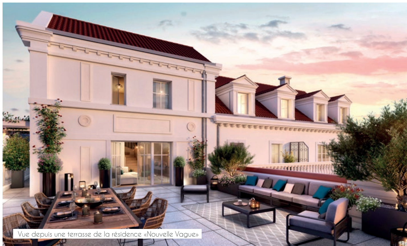
Vue depuis une terrasse de la résidence «Nouvelle Vague»

La disposition des résidences permettra à la plupart des appartements de profiter d'ouvertures vers le cœur d'îlot paysager ainsi que le canal.