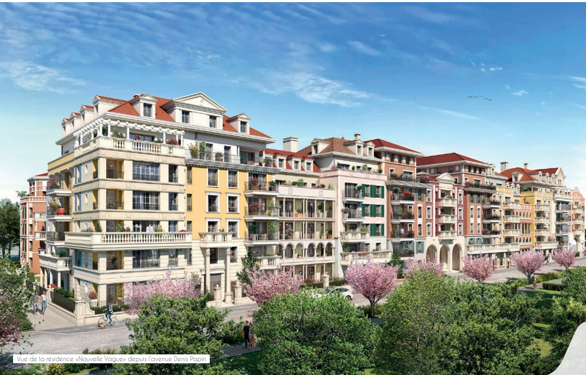
Vue de la résidence «Nouvelle Vague» depuis l'avenue Denis Papin