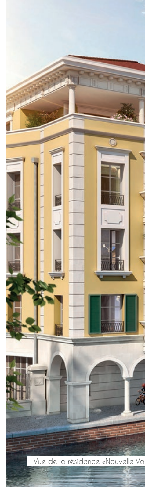
Vue de la résidence «Nouvelle Va

Nouvelle Vague , c'est aussi la promesse d'un quotidien florissant.