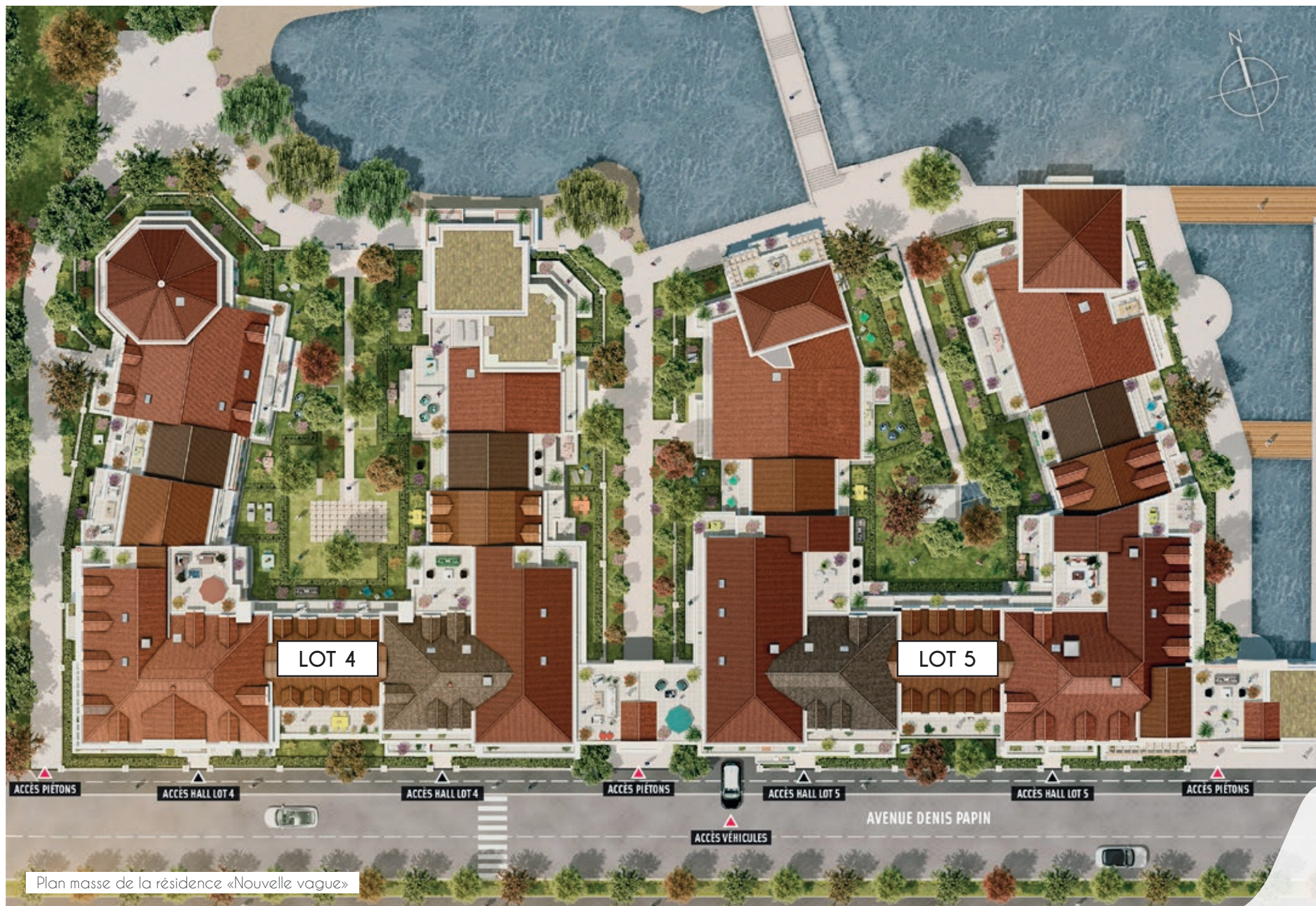
Plan masse de la résidence «Nouvelle vague»