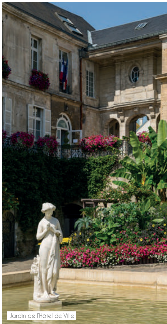
Jardin de l'Hôtel de Ville

Doté d'un environnement vert, d'une architecture harmonieuse, Le Plessis-Robinson se démarque par l'originalité de son patrimoine. Située dans le sud du département des Hauts-de-Seine, cette commune authentique souhaite conserver son esprit de village et ses traditions.