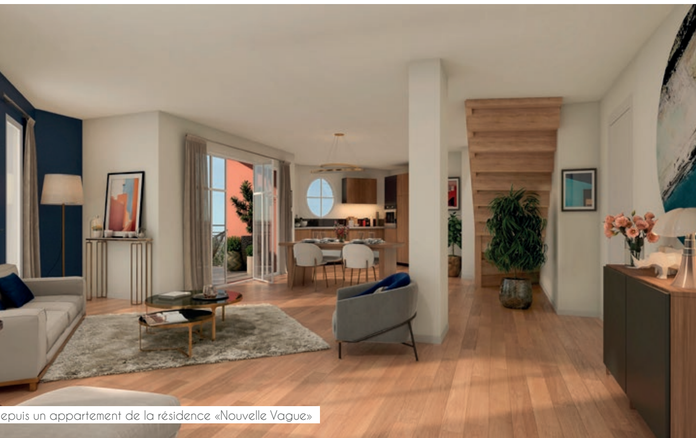
Depuis un appartement de la résidence «Nouvelle Vague»