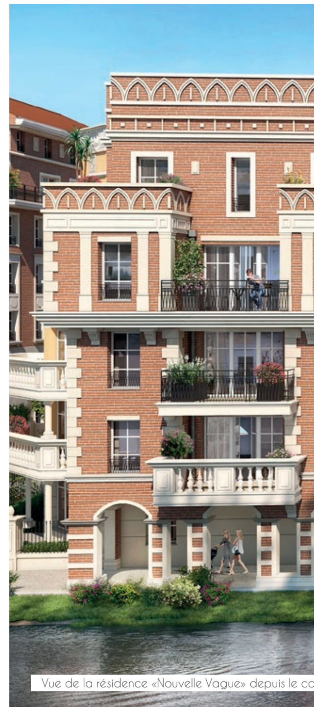
Vue de la résidence «Nouvelle Vague» depuis le co

De plus, Nouvelle vague offre la possibilité de personnaliser son logement via un configurateur*. Cet outil innovant vous rend acteur de votre projet en vous donnant la possibilité de personnaliser votre logement, en permettant, par exemple, des modifications de plans et des choix de matériaux.