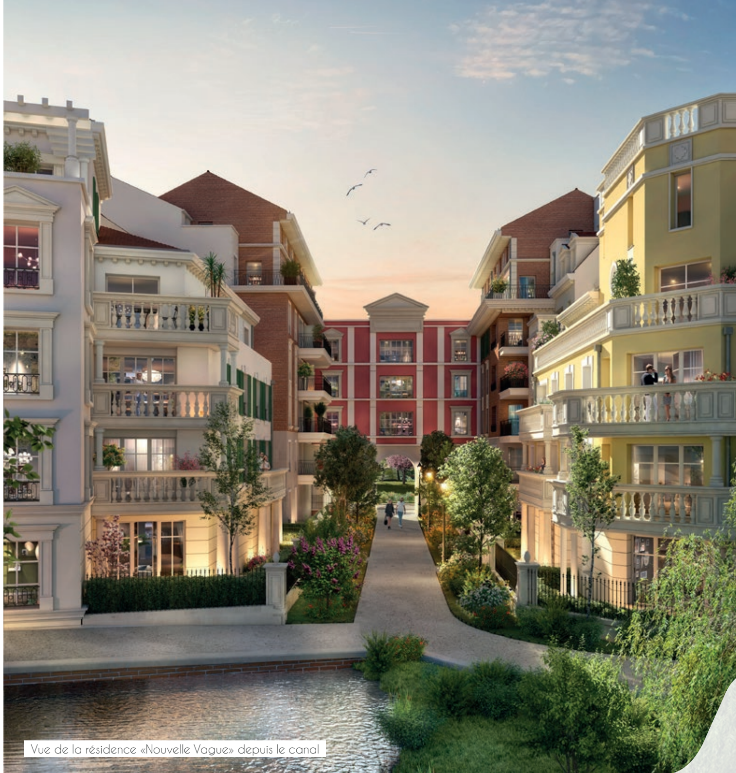
Vue de la résidence «Nouvelle Vague» depuis le canal