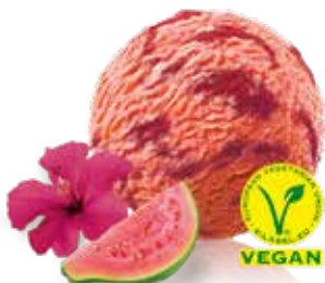
Sorbet Tropic Guave Hibiskus