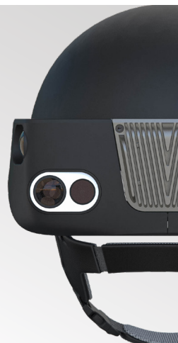
Scanner 3D portatif pour le BTP CEA List Poc In Labs 2022