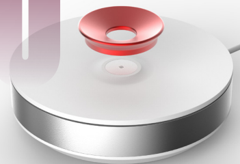
Micro-mélangeur de gouttes C2N (Centre de nanosciences et de nanotechnologies) Poc In Labs 2020