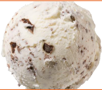
Irish Cream Likör