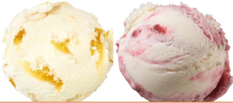
Lemon Curd Crisp Joghurt Rote Grütze