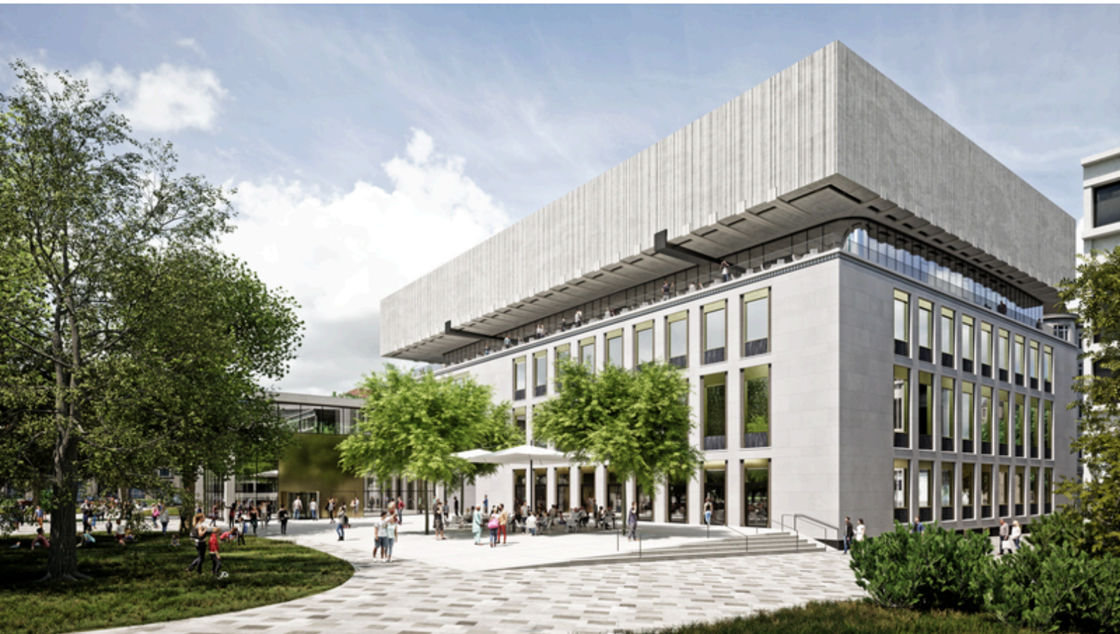
Das neue Wien Museum