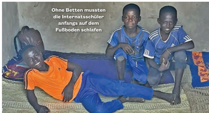
Ohne Betten mussten die Internatsschüler anfangs auf dem Fußboden schlafen