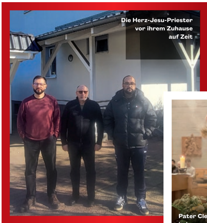
Die Herz-Jesu-Priester vor ihrem Zuhause auf Zeit