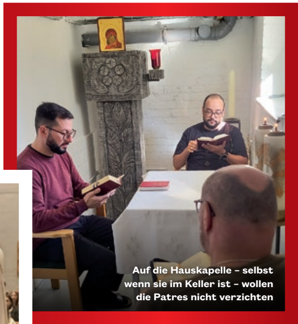
Auf die Hauskapelle – selbst wenn sie im Keller ist – wollen die Patres nicht verzichten

„Neben den vielen alltäglichen Aufgaben im pastoralen Dienst sehe ich genau hier meine Schwerpunkte. Die Arbeit mit jungen Menschen ist mir wichtig, weil sie die Gegenwart und die Zukunft der Gemeinde prägen. Diese Begleitung möchte ich weiter vertiefen und entwickeln.“