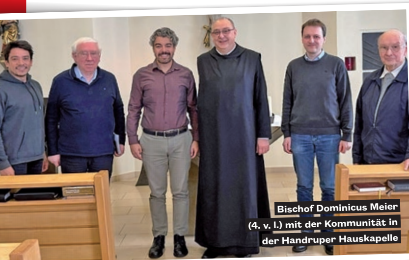
Bischof Dominicus Meier (4. v. l.) mit der Kommunität in der Handruper Hauskapelle