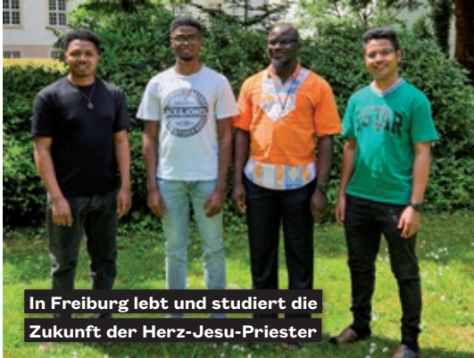
In Freiburg lebt und studiert die Zukunft der Herz-Jesu-Priester