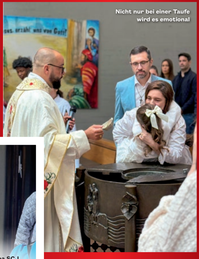
Nicht nur bei einer Taufe wird es emotional