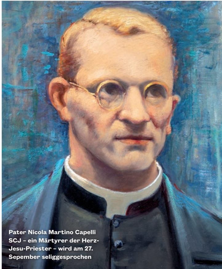
Pater Nicola Martino Capelli SCJ – ein Märtyrer der Herz- Jesu-Priester – wird am 27. September seliggesprochen