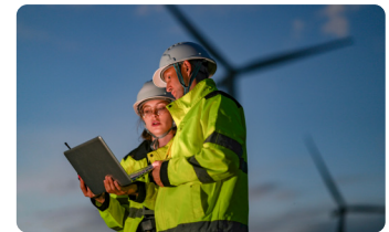
Asesorías en la selección de productos y equipos