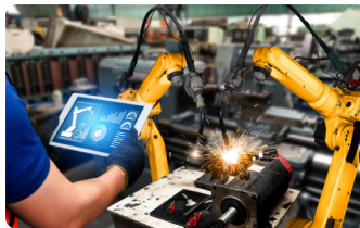
Las mejores gamas de productos del mercado industrial