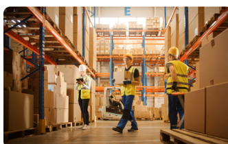
Confiability en las entregas