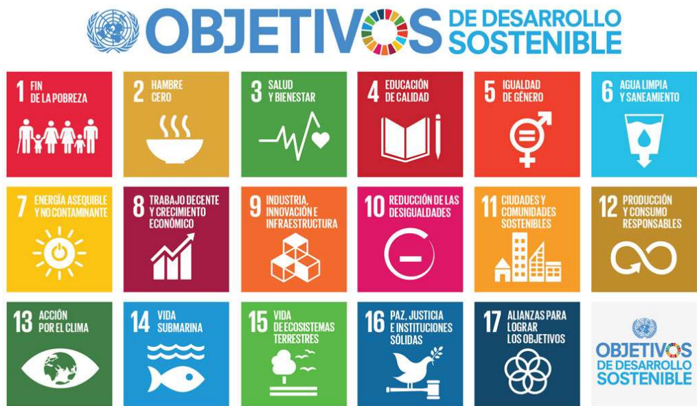
Objetivos de Desarrollo Sostenible (ODS) - Agenda 2030 de Naciones Unidas

La Agenda 2030 plantea 17 Objetivos con 169 metas de carácter integrado e indivisible que abarcan las esferas económica, social y ambiental.