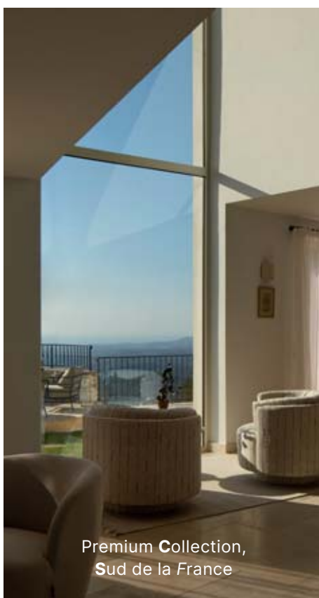
Premium Collection, Sud de la France