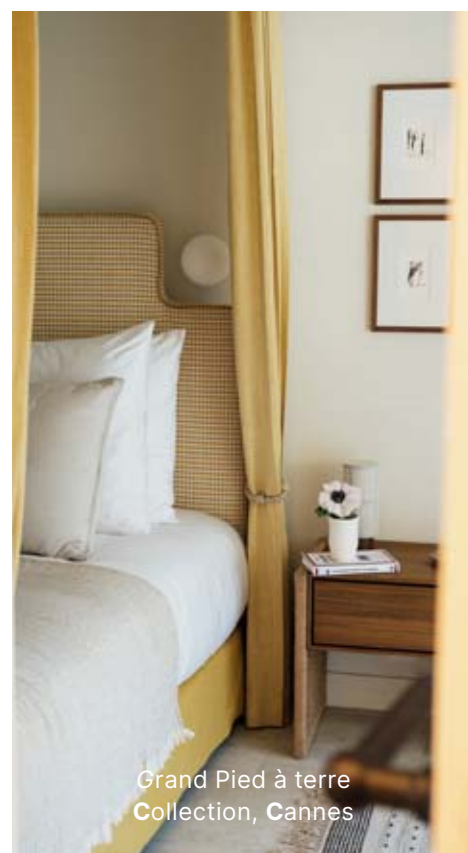
Grand Pied à terre Collection, Cannes