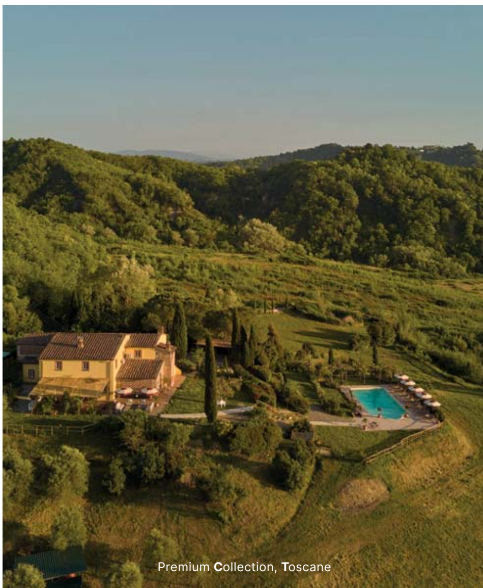
Premium Collection, Toscane

Pour un nombre croissant de familles belges, le luxe aujourd'hui est une question de temps, de beauté et de liberté — et la découverte que la propriété, lorsqu'elle est repensée avec soin, peut ouvrir la porte à bien plus qu'une seule maison.