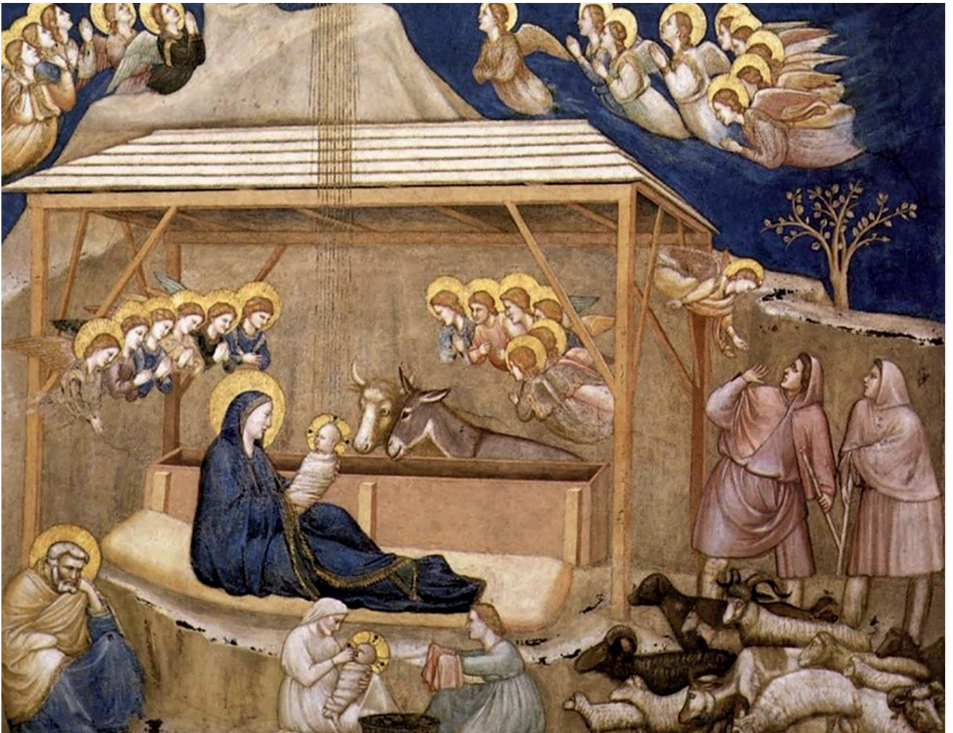
Die Geburt Jesu, Giotto di Bondone, ca. 1313 n. Chr., Fresko in der Kirche San Francesco, Assisi