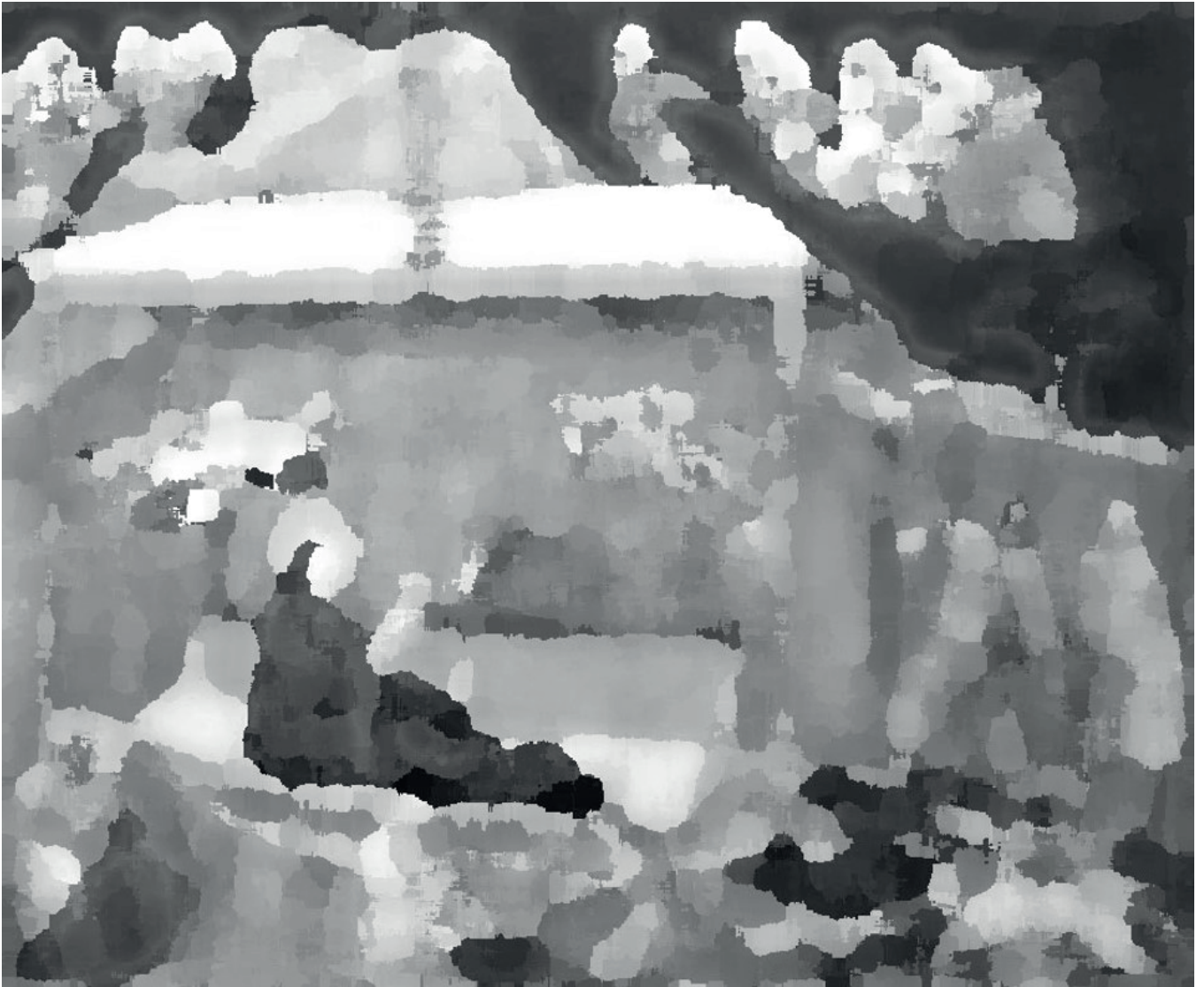
Die Geburt Jesu, Giotto di Bondone, ca. 1313 n. Chr., Fresko in der Kirche San Francesco, Assisi, verfremdet mit Photoshop