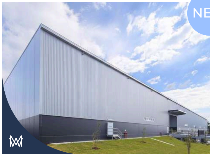
#PAU_EKC-IND | AANDELENTTRANSACTIE