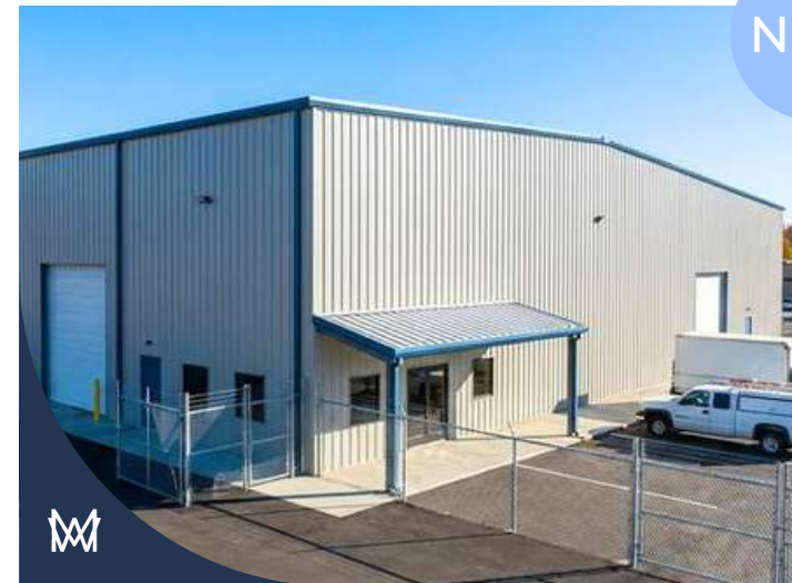
#OLK_CER-IND | DOSSIER AANVRAGEN