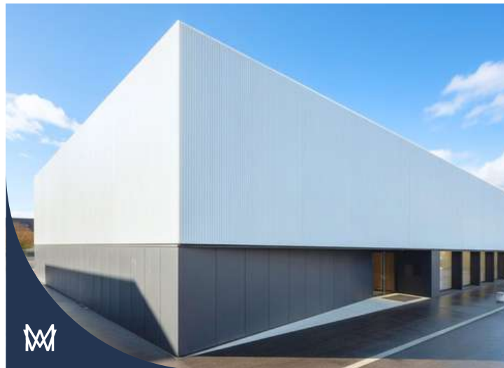
#KCI_KJI-IND | DOSSIER AANVRAGEN