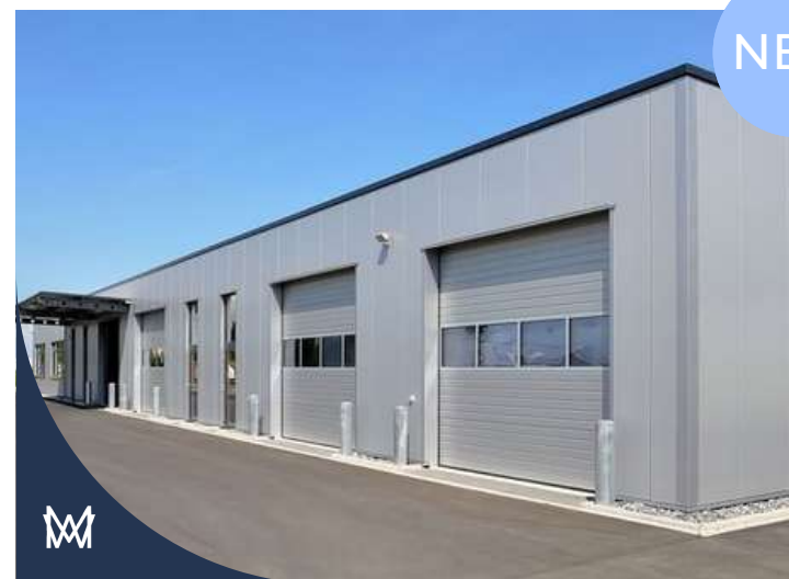
#TIN_TLE-IND | VASTGOEDTRANSACTIE