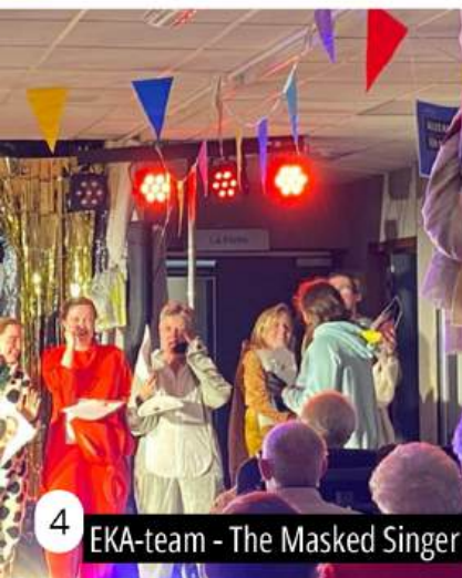
4 EKA-team - The Masked Singer