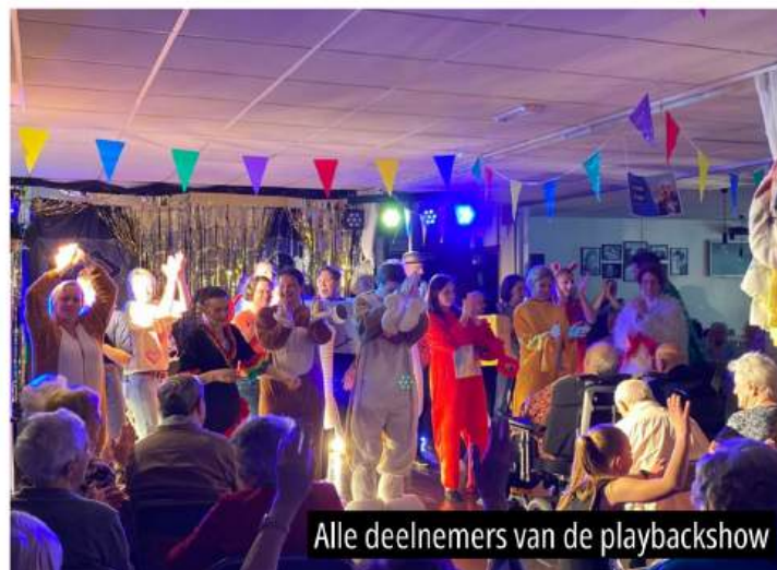
Alle deelnemers van de playbackshow