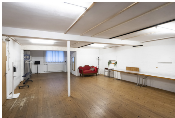
Foyer / Backstage