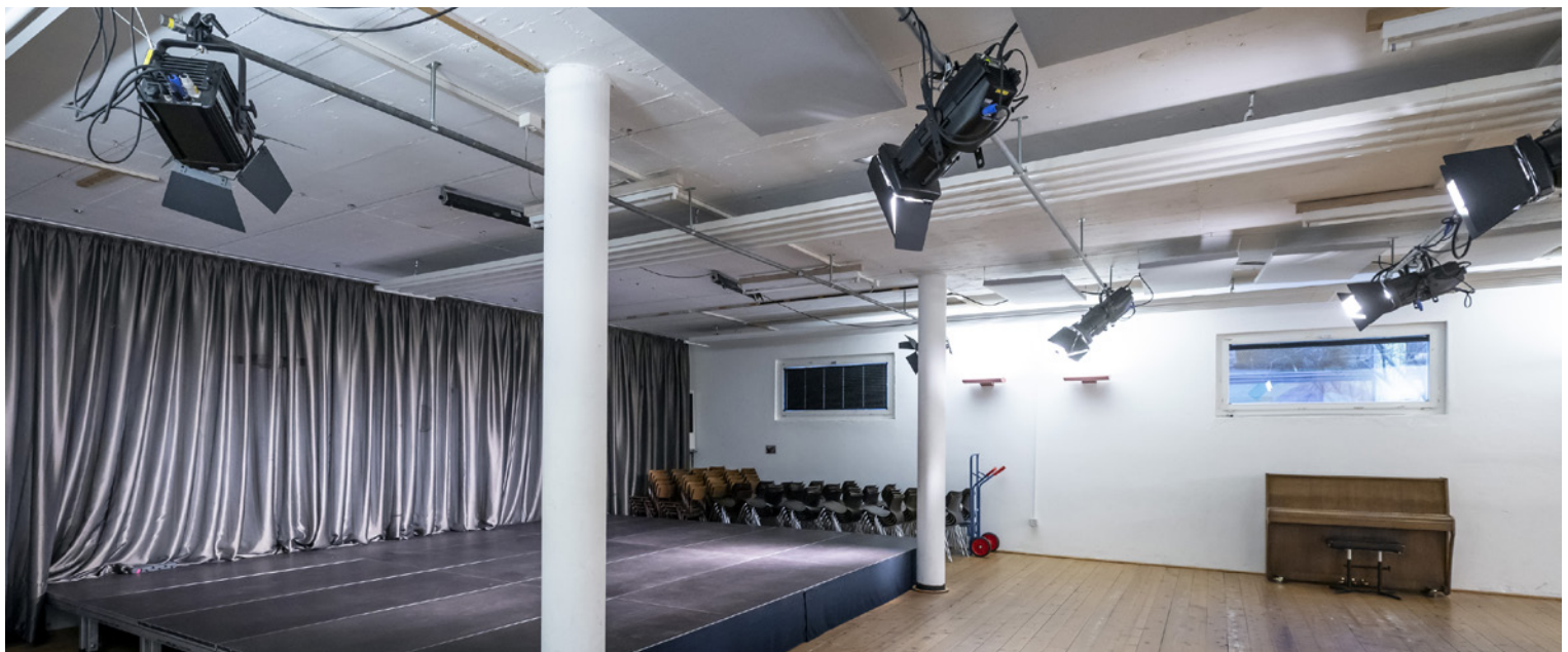
Bühne mit Beleuchtung

Es gelten besondere Nutzungsbestimmungen. Die Kenntnisnahme ist beim Checkout zu bestätigen.